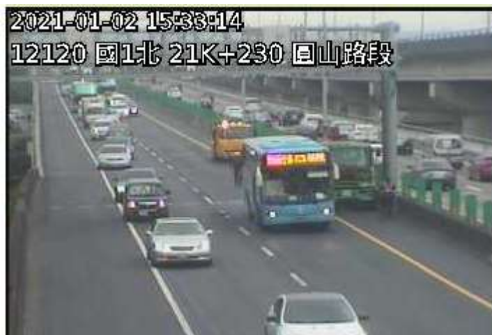
圖 2-15 時 29 分國 1 北向 21.4 公里處 1 輛大貨車及 1 輛大客車追撞事故，回堵 5 公里