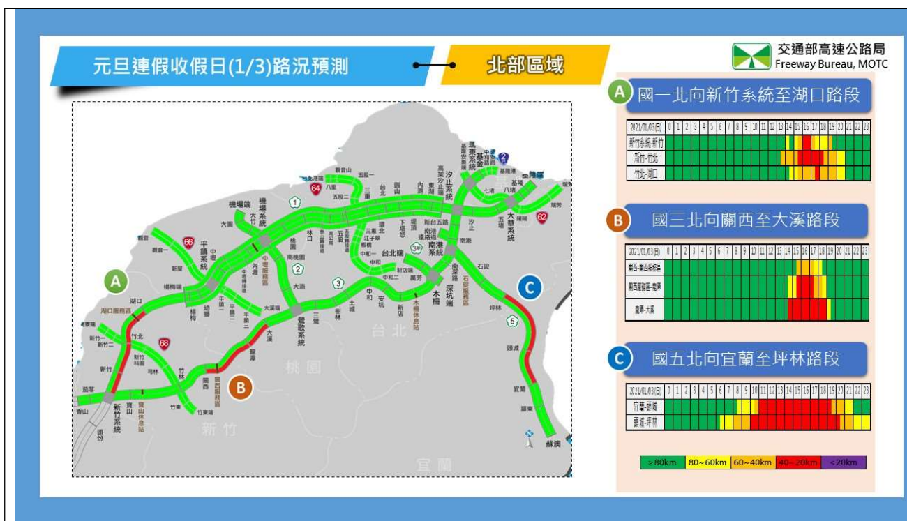
圖 3-元旦第 3 日北部路段北向路況預報圖