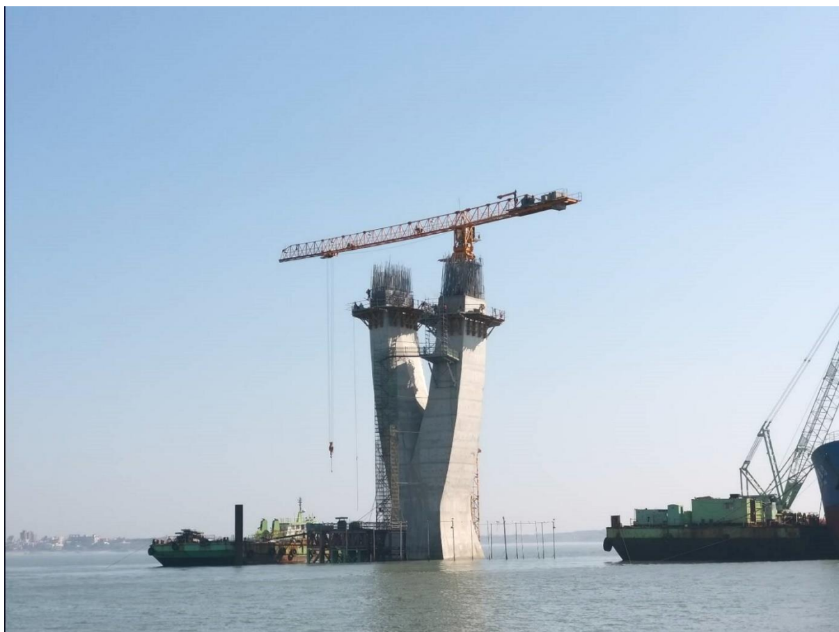
圖 4. P46 遠景