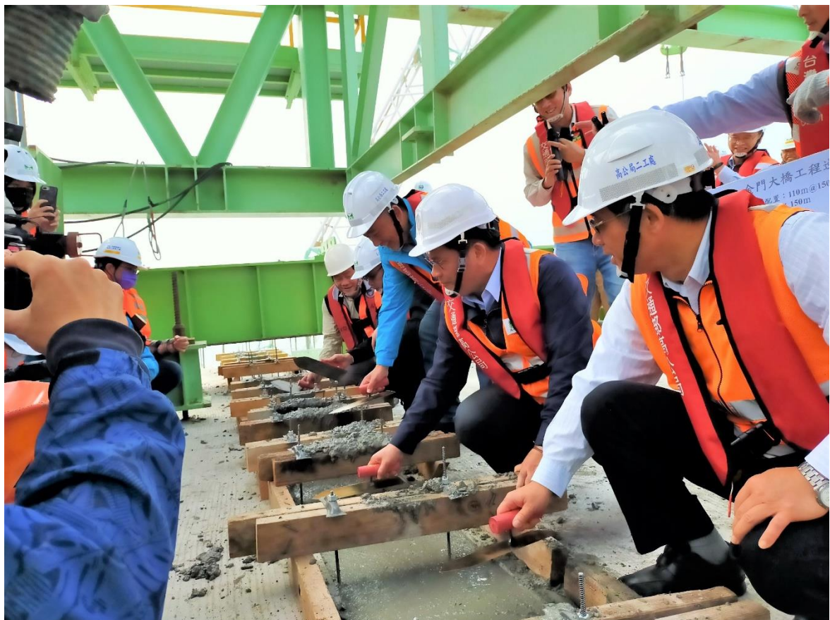
圖 2. 交通部林佳龍部長見證金門大橋深槽區第一跨上跨合攏