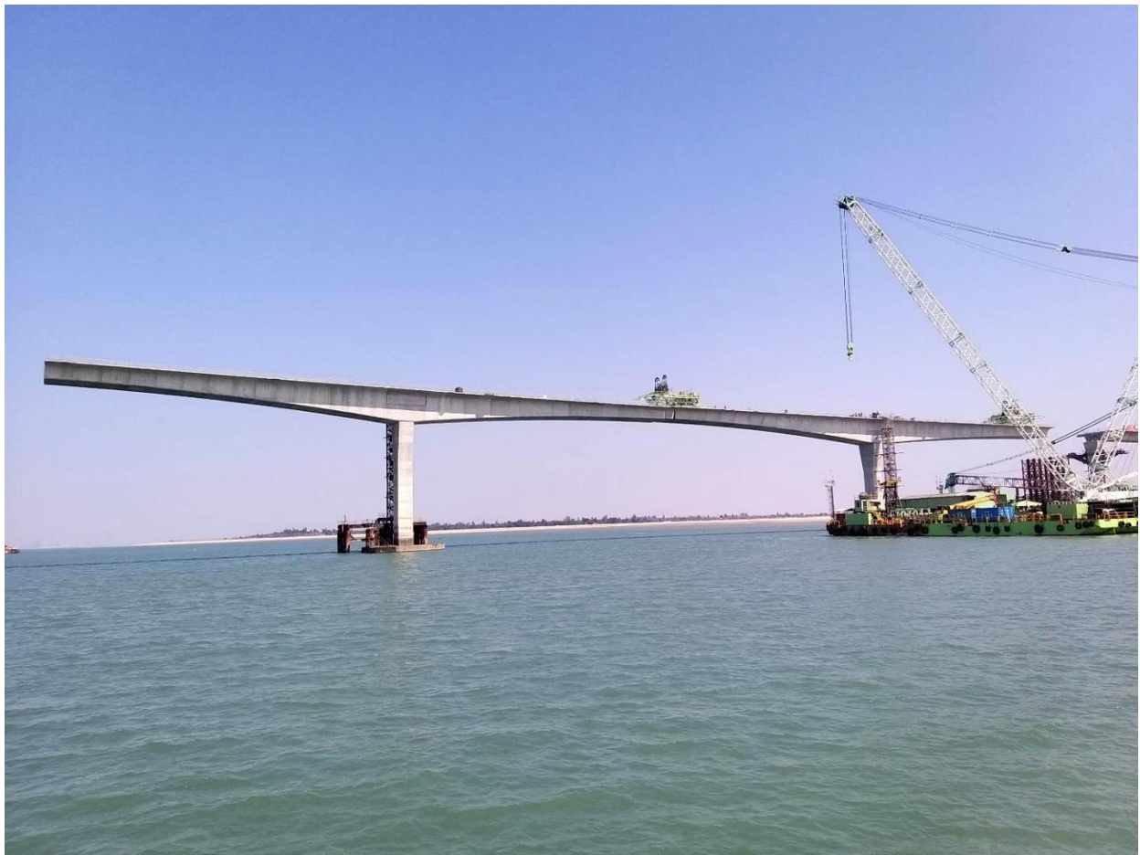
圖 7. P50-P51 閉合節塊吊裝完成