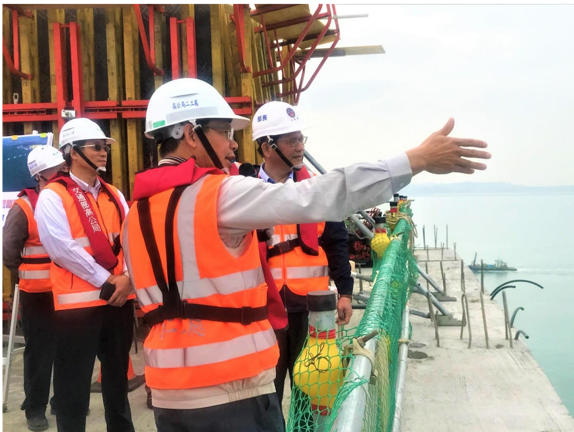
圖 3. 交通部林佳龍部長視察金門大橋工程施工進度