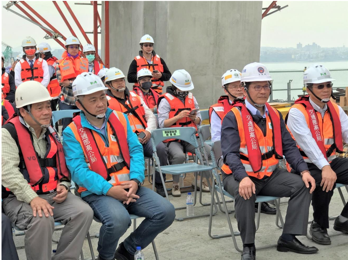
圖 1. 交通部林佳龍部長（右 2）聽取金門大橋工程簡報