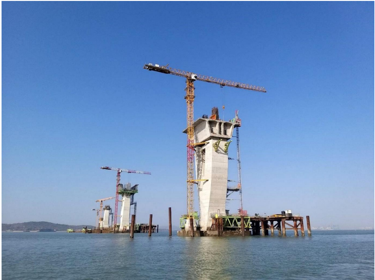
圖 5. P48 遠眺