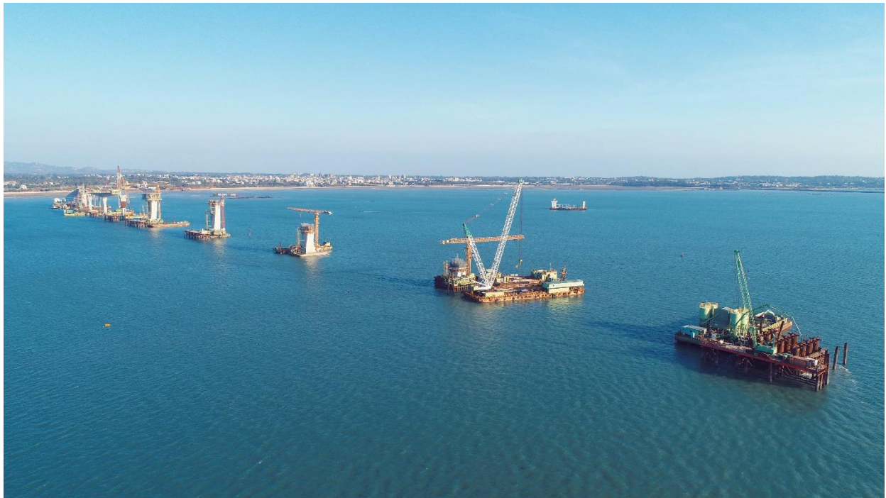
圖 8. 深槽區全景