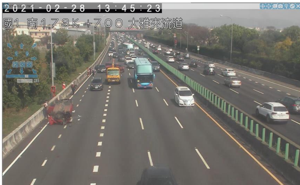
附圖 1 國 1 南向 173.6 公里處發生 6 輛小客車追撞事故