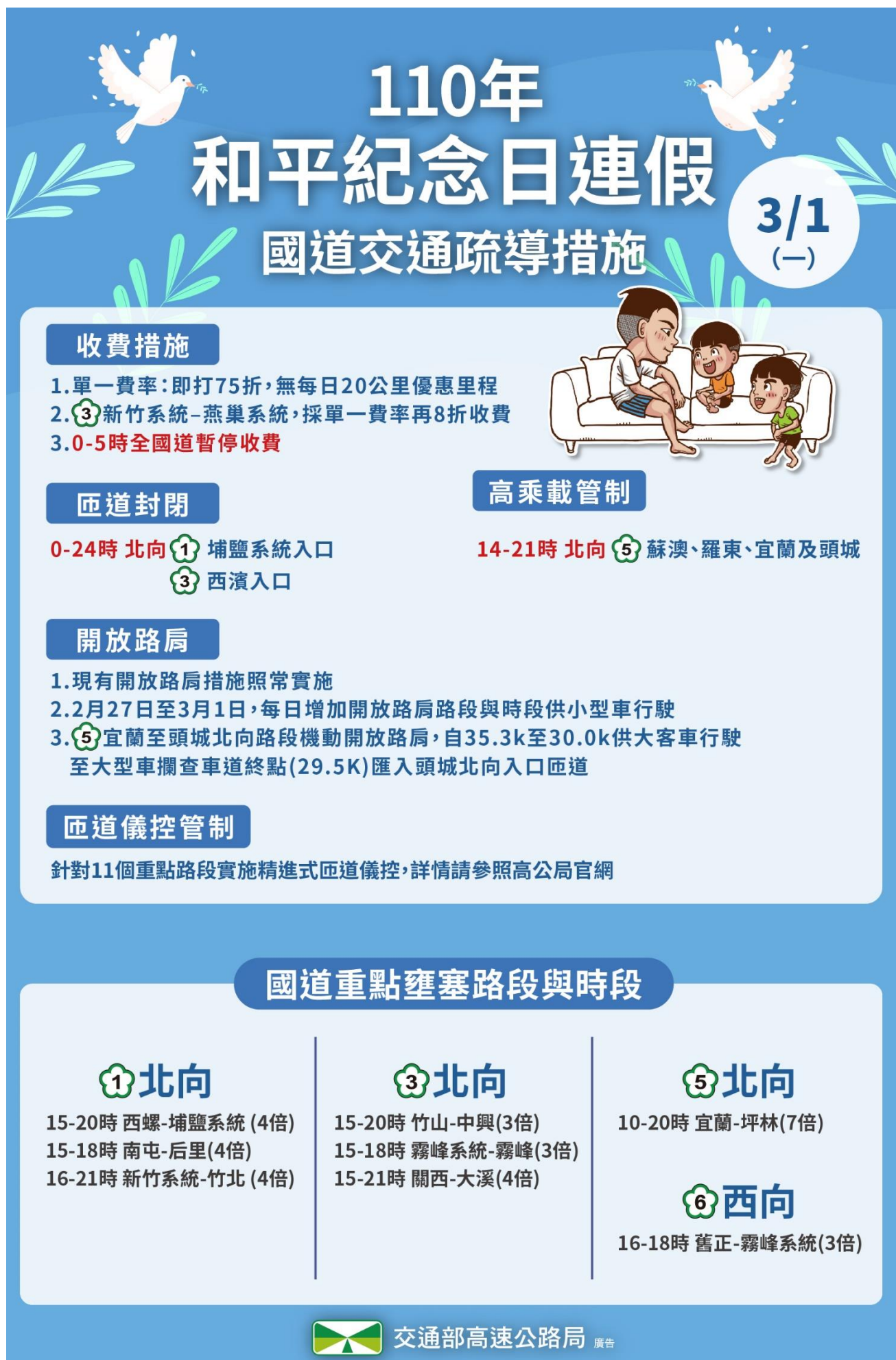
附圖 5：110 年和平連假收假日國道疏導措施