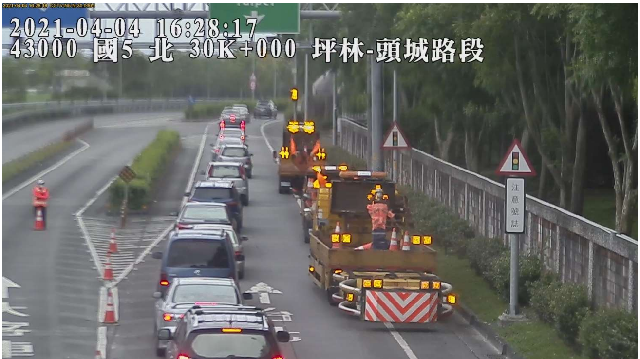
附圖 8 國 5 北向 29.5 公里發生 3 輛小客車追撞事故，占用內側車道