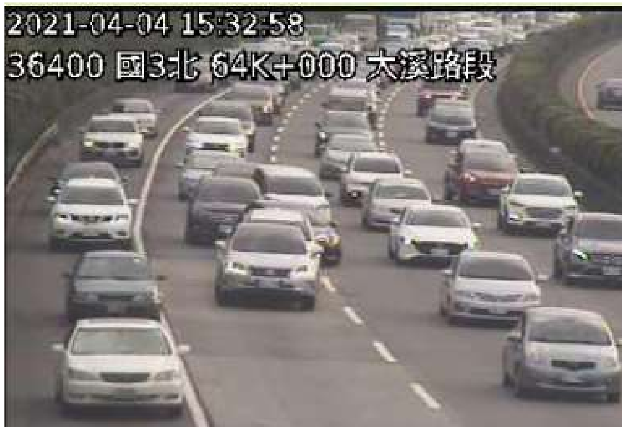
附圖 6 國 3 北向 66.1 公里發生 2 輛小客車追撞事故，占用外側車道