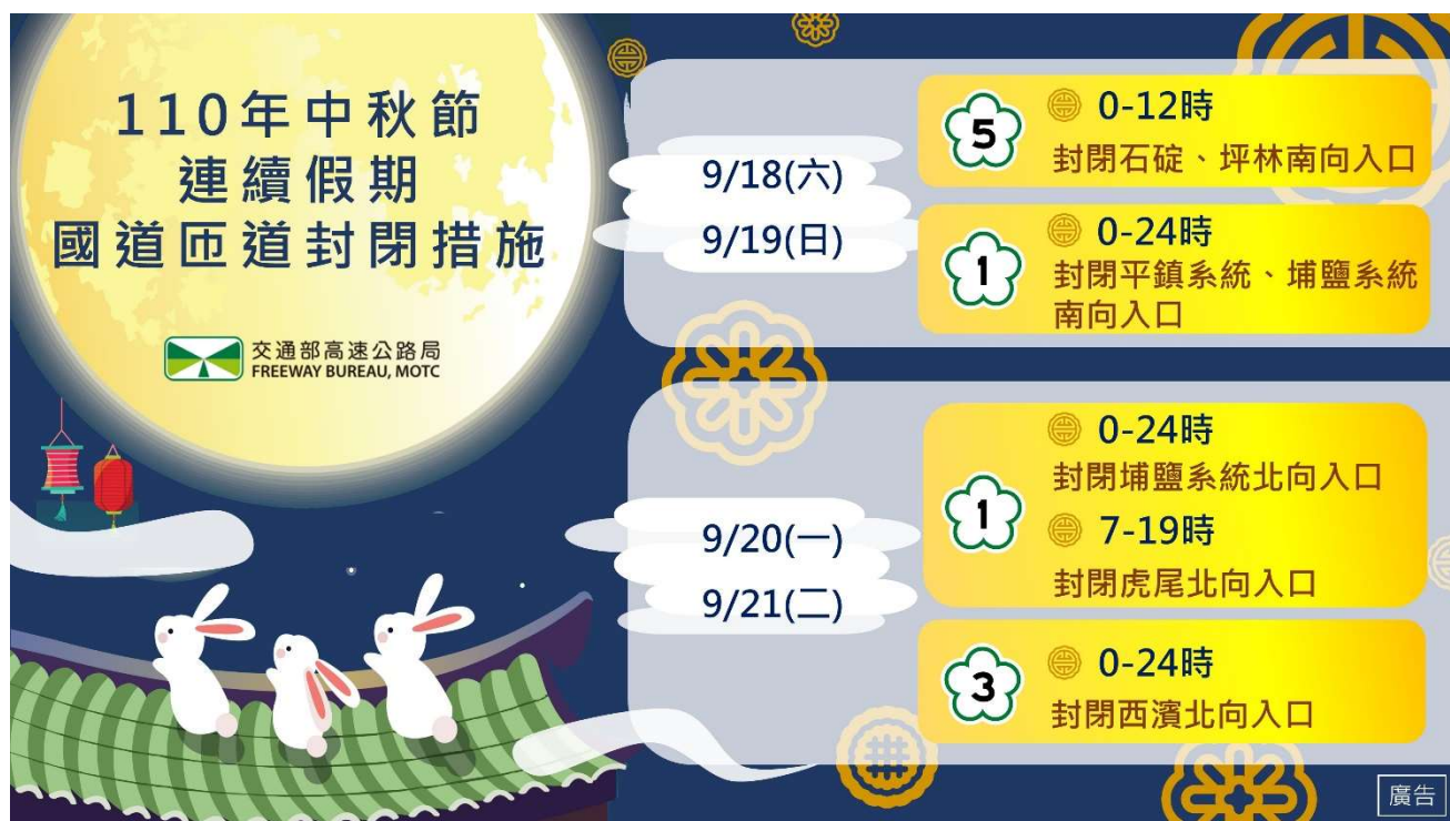
附圖 3 中秋節連續假期 國道匝道封閉措施