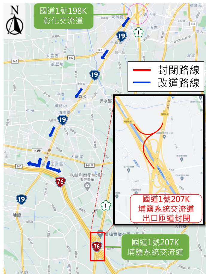
圖 1 往埔鹽系統南下出口匝道替代道路(一)