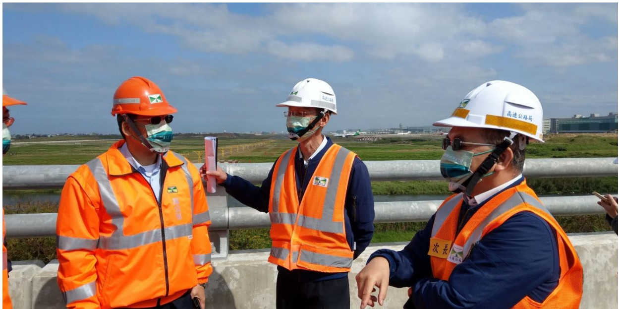
圖 4. 次長視察視察國 2 甲線工程(機場航道下方緊急避車彎處)