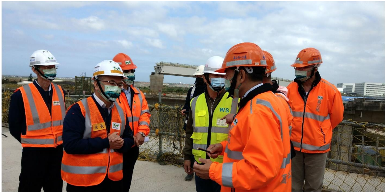
圖 1. 次長視察視察國 2 甲線新闢工程