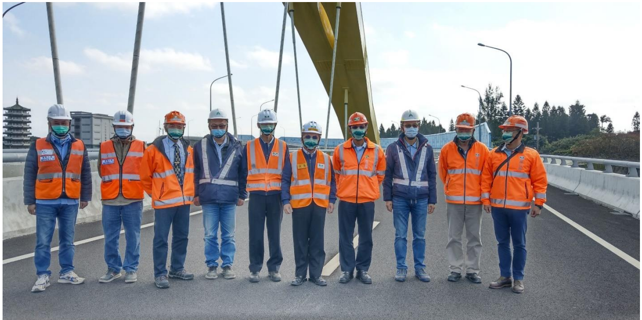
圖 3. 次長視察視察國 2 甲線起點圳頭交流道鋼拱橋