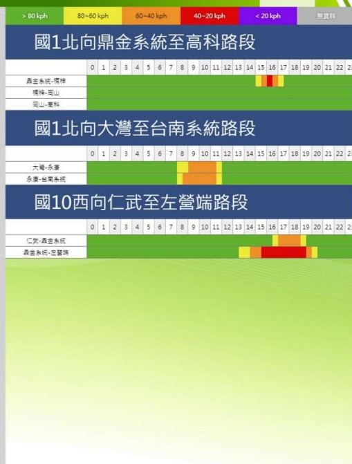
清明節連假第4日南部路段北向路況預報圖