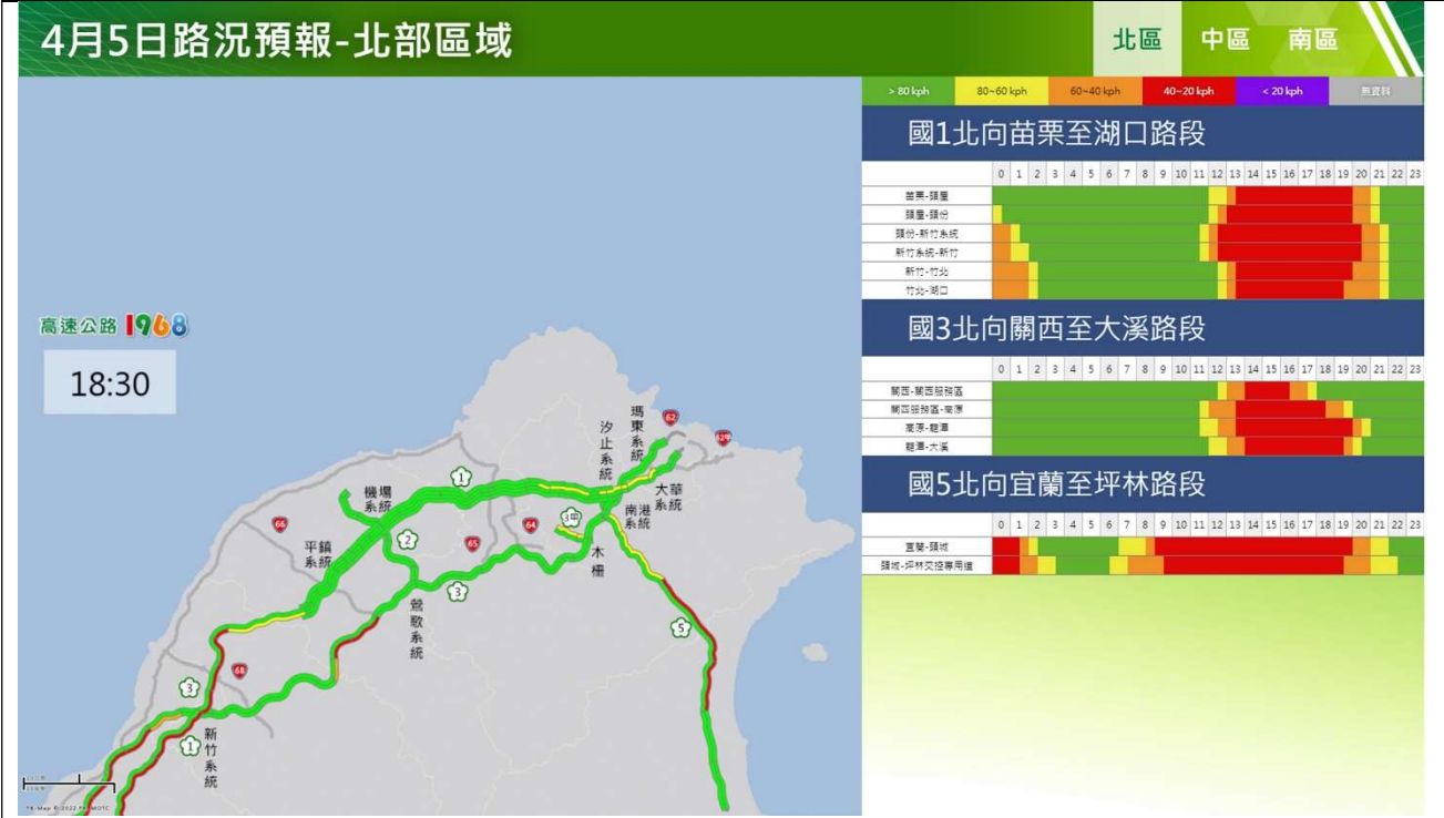
清明節連假第 4 日北部路段北向路況預報圖