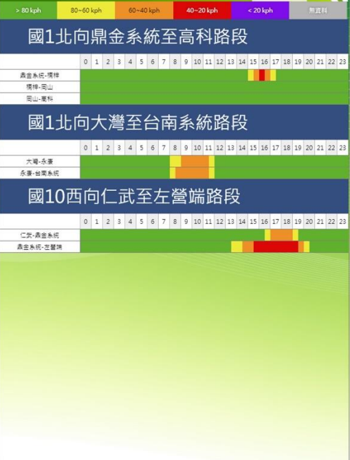
清明節連假第 4 日南部路段北向路況預報圖