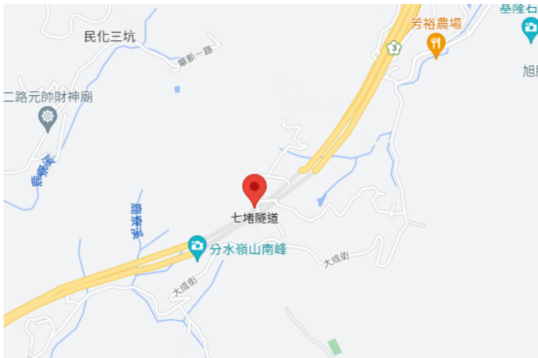
圖 1 施工位置-國道 3 號七堵隧道北口南下側