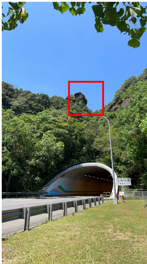
圖 2 七堵隧道北口南下全景