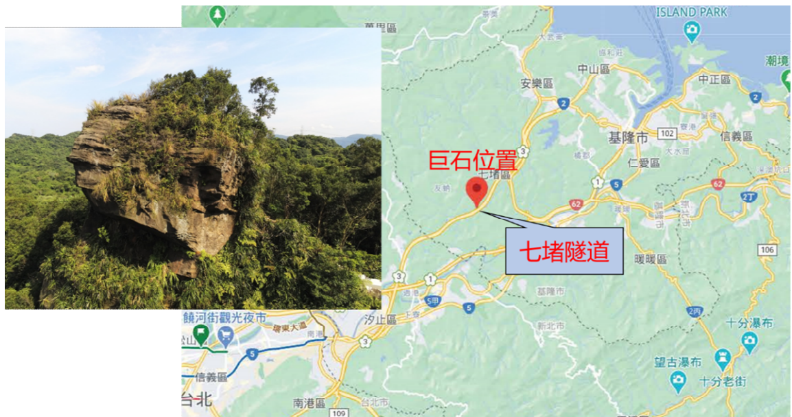
圖 3 七堵隧道北口上方巨石近照