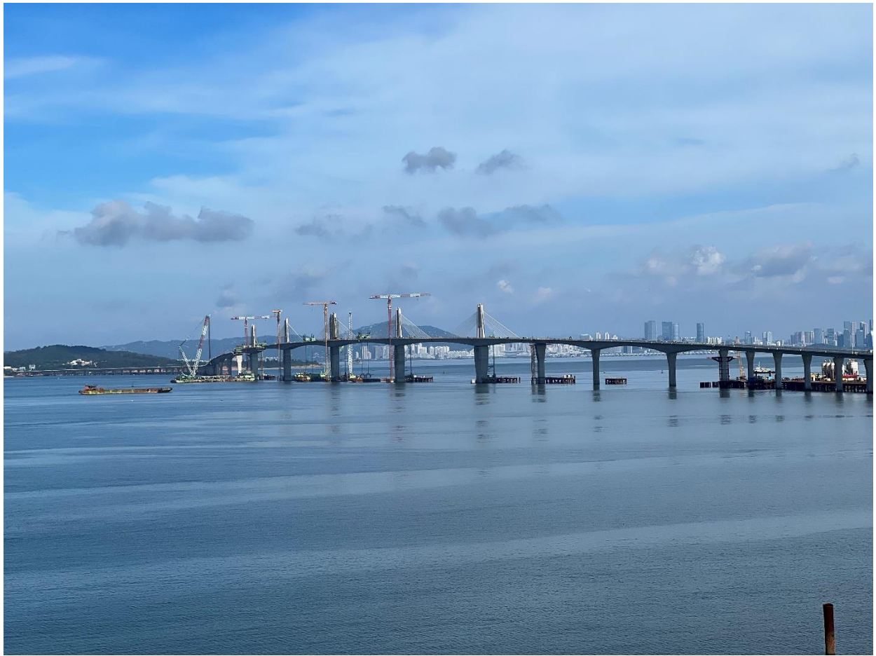
圖 a 金門大橋全線施工現況