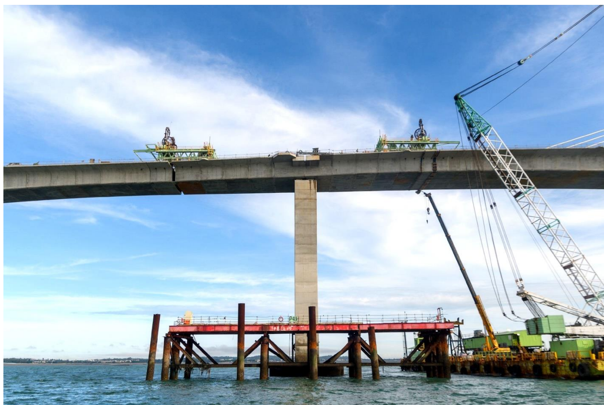
圖 c P49 閉合節塊濕接縫組模