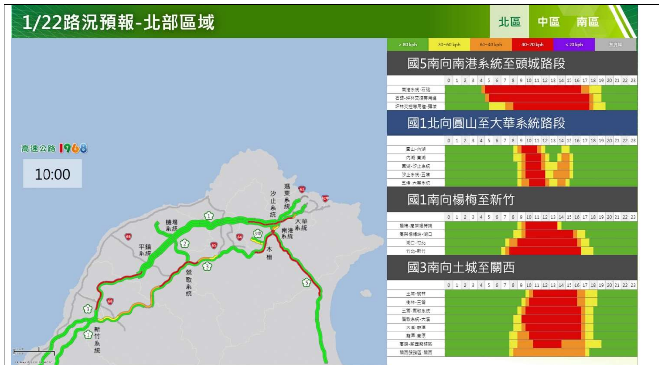
春節連假初一北部路段南向路況預報圖