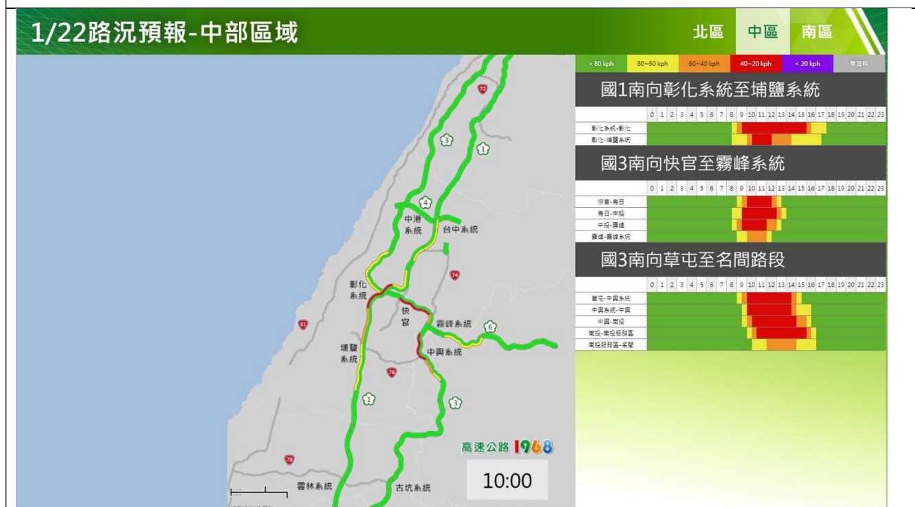
春節連假初一中部路段南向路況預報圖