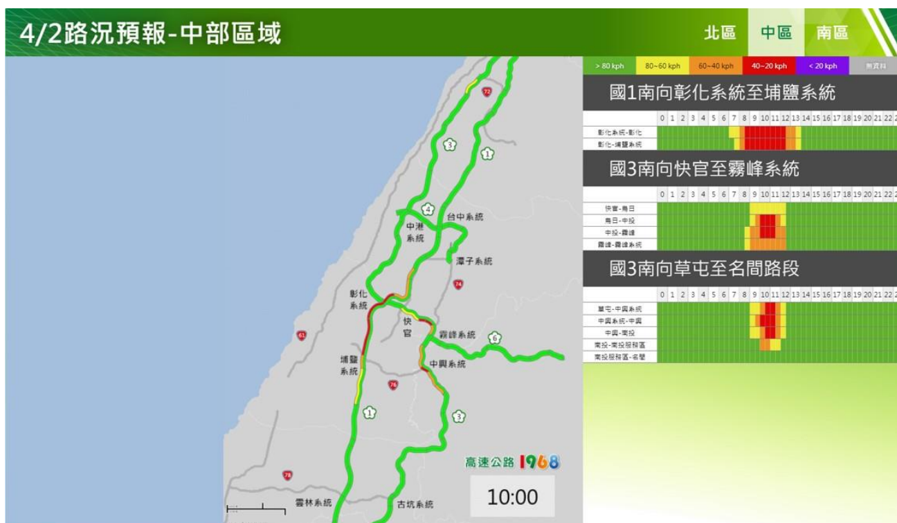
附圖 8：清明節連假第 2 日路況預測(中區)