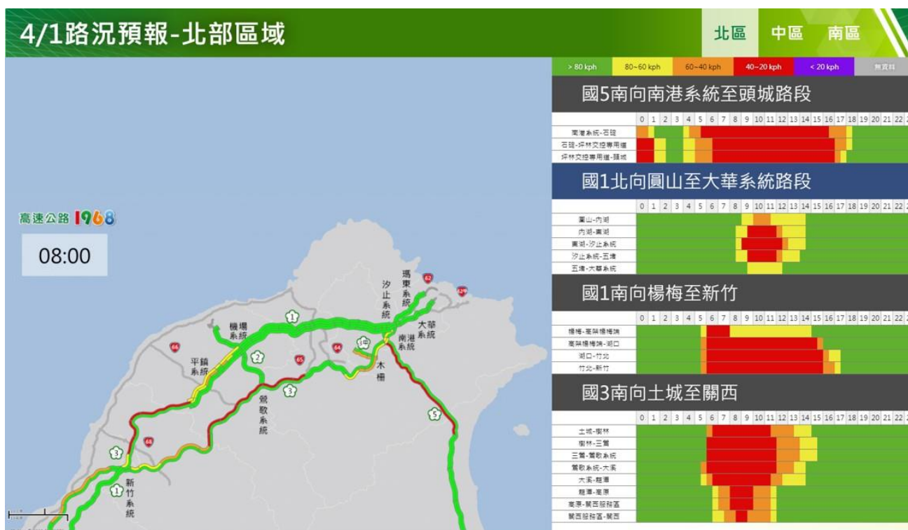
附圖 4：清明節連假首日路況預測(北區)