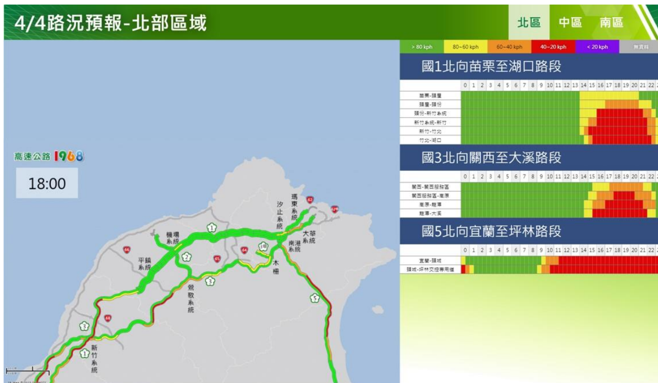
附圖 13：清明節連假第 4 日路況預測(北區)