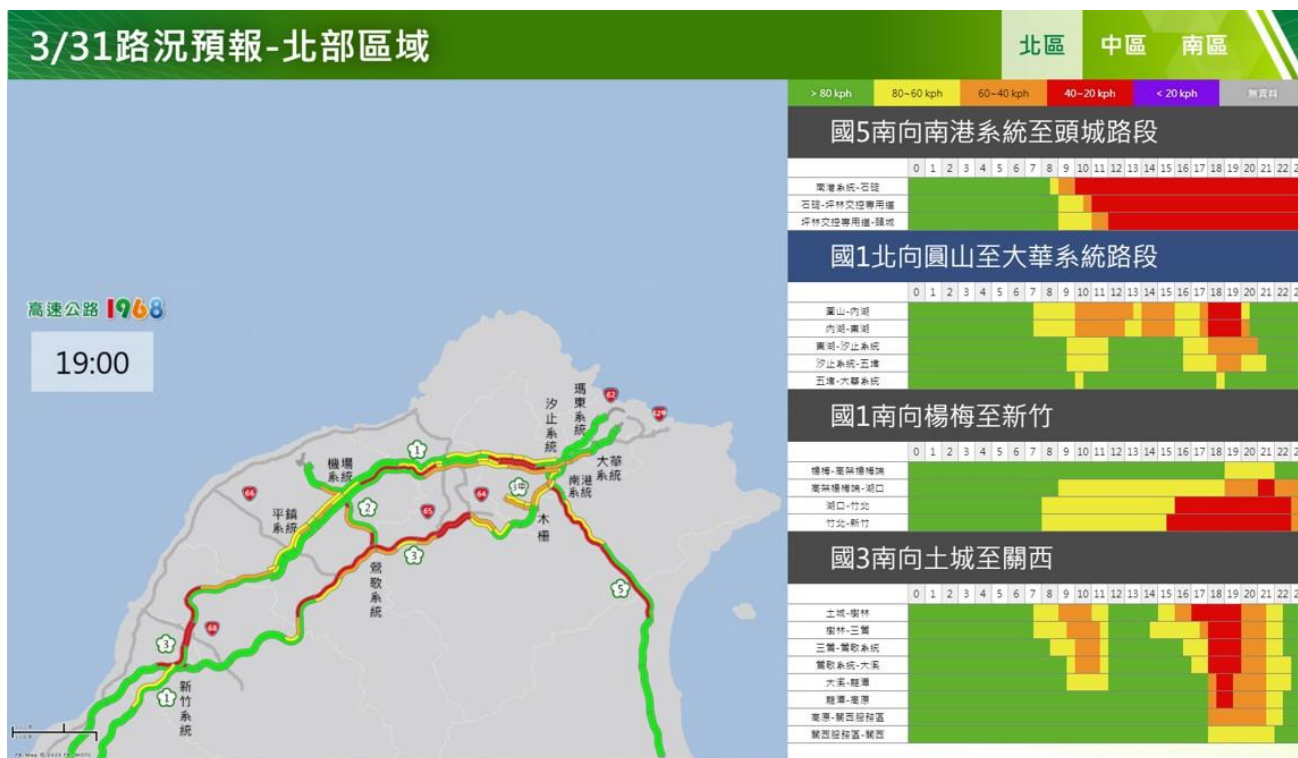
附圖 1：清明節連假前 1 日路況預測(北區)