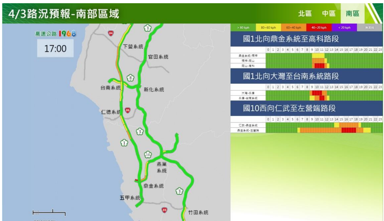
附圖 12：清明節連假第 3 日路況預測(南區)