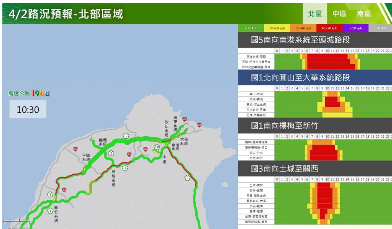
附圖 7：清明節連假第 2 日路況預測(北區)