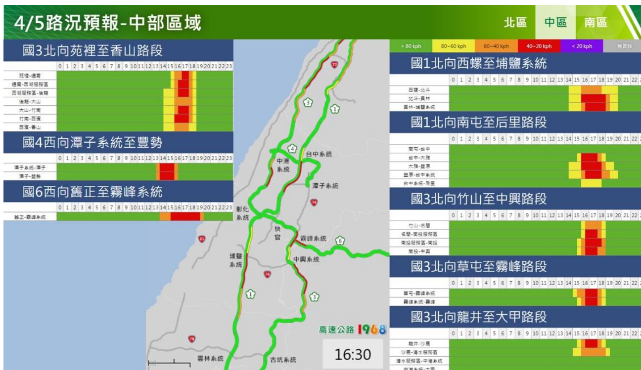
附圖 17：清明節連假收假日路況預測(中區)