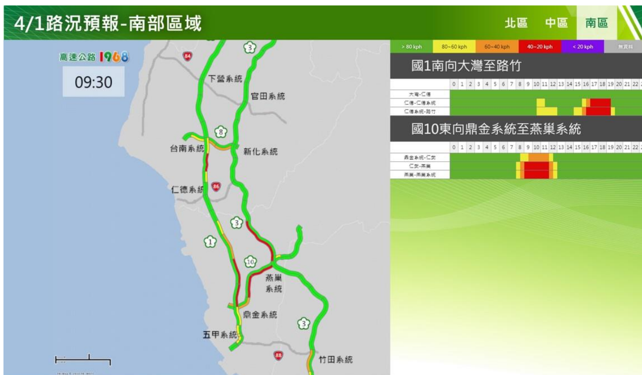
附圖 6：清明節連假首日路況預測(南區)