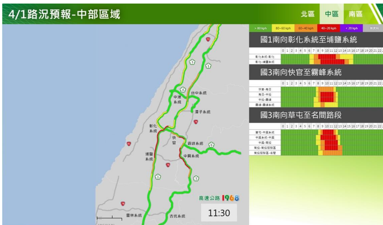
附圖 5：清明節連假首日路況預測(中區)