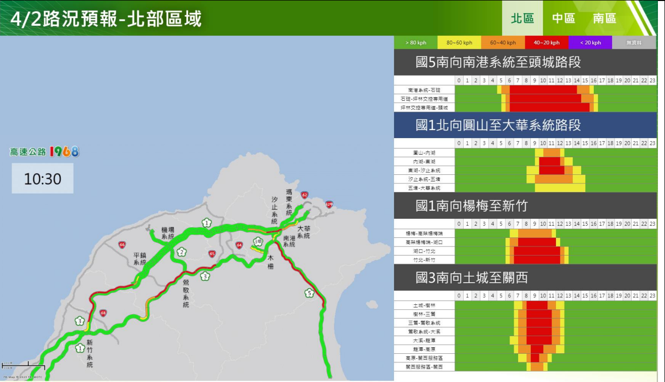
清明節連假第 2 日北部路段南向路況預報圖