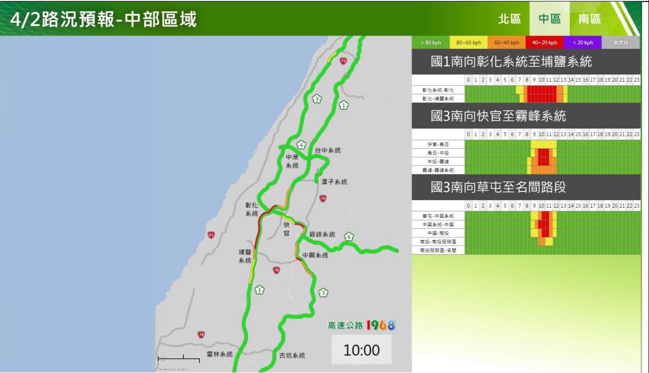
清明節連假第 2 日中部路段南向路況預報圖