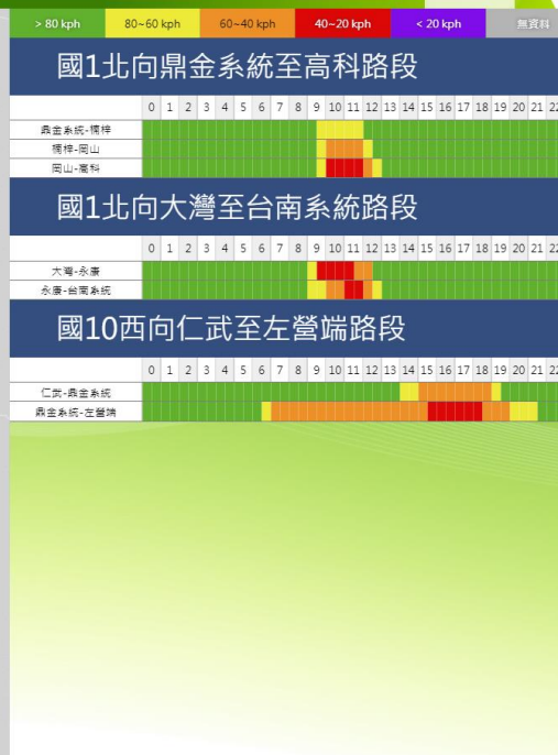
清明節連假第4日南部路段北向路況預報圖