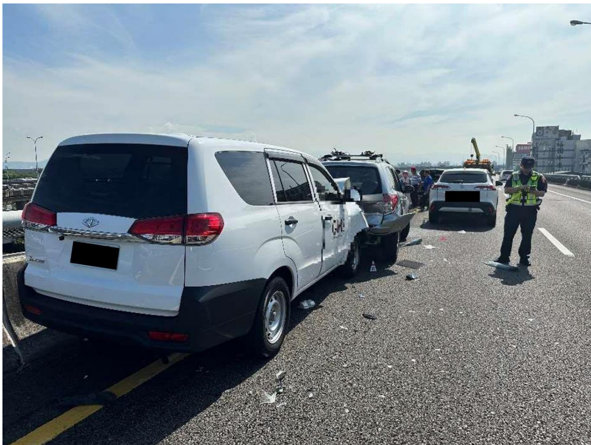
附圖 1 國 1 高架北向 32 公里處事故，多車連環撞