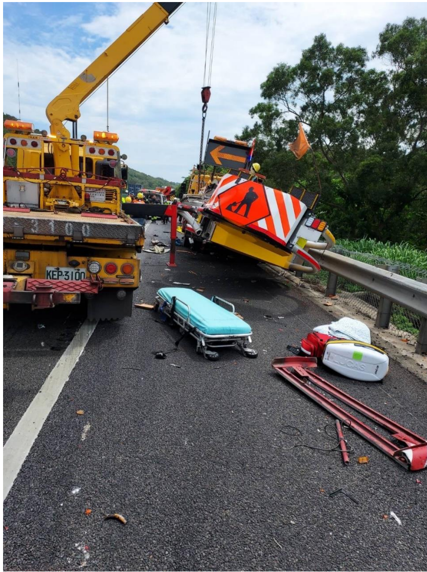
附圖 3 國 3 北 141 公里處事故，遭撞之緩撞車