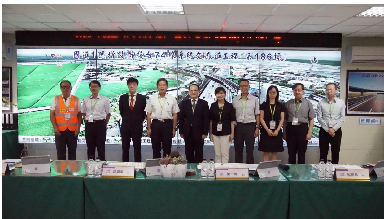
圖 2 評選委員與法務部及交通部代表暨受評機關等人合照。