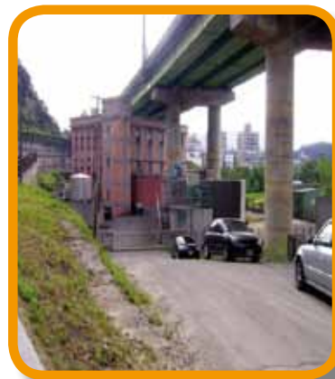
新北市政府水利局租用國道 3 號 南港聯絡道 0k+753.5 ~ 0k+853.5 設置民權抽水站