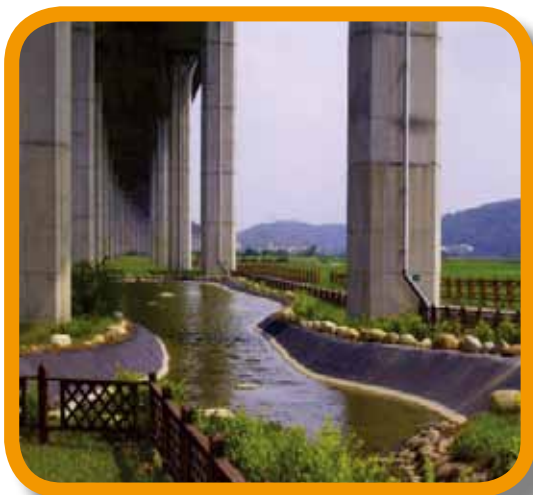
西湖鄉公所於國道 3 號 136k+100 ~ 138k+200 高架橋下設置自行車道、植栽綠化及活動廣場

五、開放國道高速公路交流道、邊坡及高架橋下景觀認養，鼓勵公私機構、法人或非法人團體參與高速公路沿線景觀維護認養工作，不僅可改善國道景觀，並有助於增加公共空間、提升鄰近社區生活環境品質；目前辦理認養有西湖鄉公所等 57 個單位。