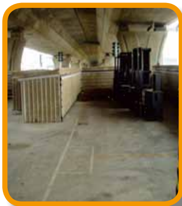
欣鐸機械(股)公司租用國道 4 號 13k+765 ~ 13k+831 設置停車場 及物料堆置區