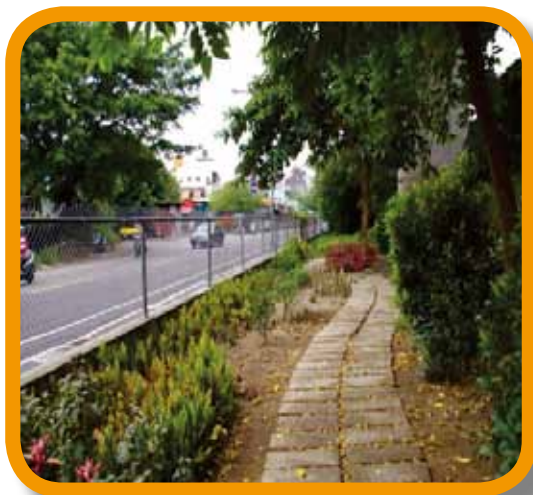
新北市三重區公所永發里於國道 1 號 28k+540 ~ 28k+700 綠美化現況