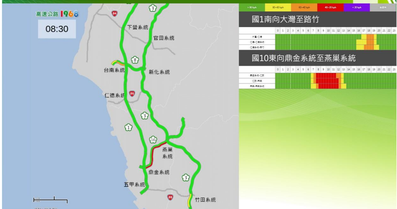
清明節連假首日南部路段南向路況預報圖