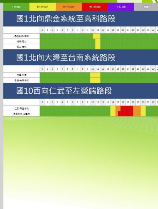
清明節連假收假日南部路段北向路況預報圖