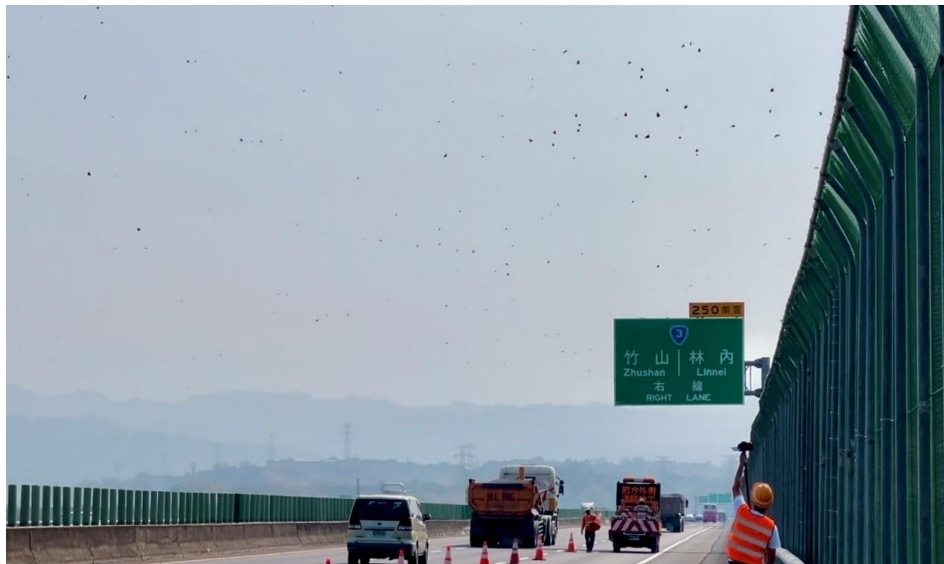
附圖 1 113 年 3 月 26 日啟動今年第 1 次國道讓蝶道，封閉國道 3 號 251K-253K 外側車道