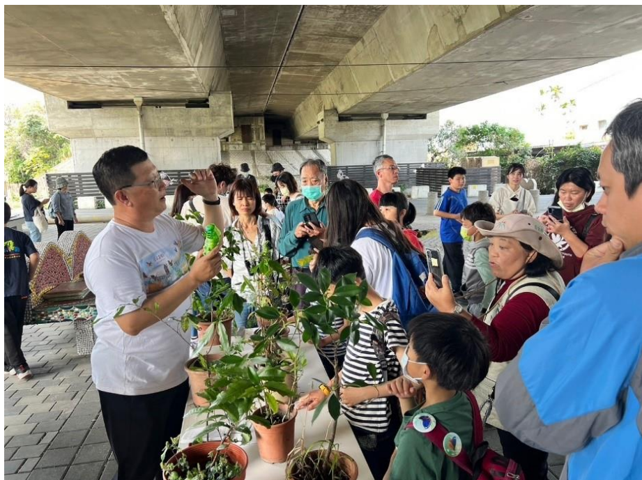
附圖 3 113 年 3 月 24 日高公局與台灣紫斑蝶生態保育協會合作辦理生態解說