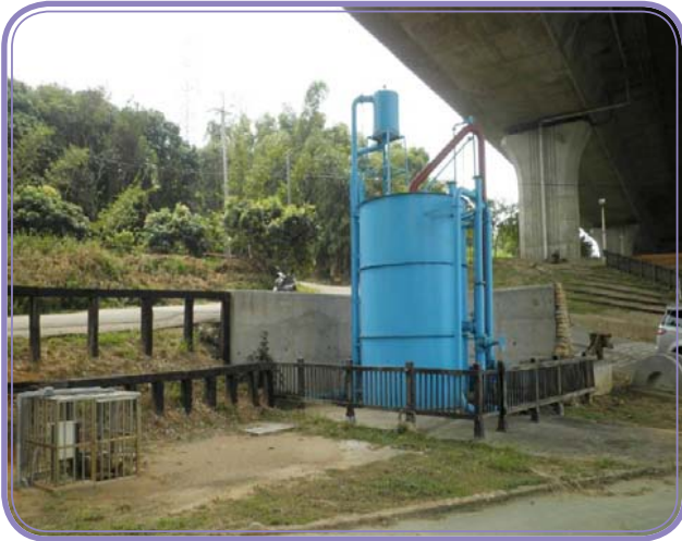
台灣自來水股份有限公司第四區管理處 租用國道 3 號 180k+592~180k+603 高架橋下土地