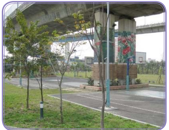
彰化市公所認養彰化系統交流道高架橋下 (匝道「3」0k+100~0k+400 及匝道「1」 0k+325~0k+638) 土地作綠美化使用