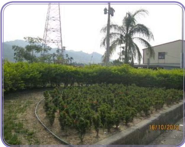
名間鄉公所認養國道 3 號名間交流道 237k 土地作綠美化使用

開放國道高速公路交流道、邊坡及高架橋下景觀認養，鼓勵公私機構、法人或非法人團體參與高速公路沿線景觀維護認養工作，不僅可改善國道景觀，並有助於增加公共空間、提升鄰近社區生活環境品質；目前辦理認養有名間鄉公所等 48 個單位。