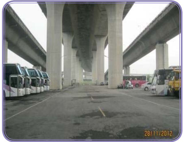
國光客運股份有限公司租用國道 3 號 208k+541~208k+831 高架橋下土地

開放國道高速公路交流道、邊坡及高架橋下景觀認養，鼓勵公私機構、法人或非法人團體參與高速公路沿線景觀維護認養工作，不僅可改善國道景觀，並有助於增加公共空間、提升鄰近社區生活環境品質；目前辦理認養有名間鄉公所等 48 個單位。