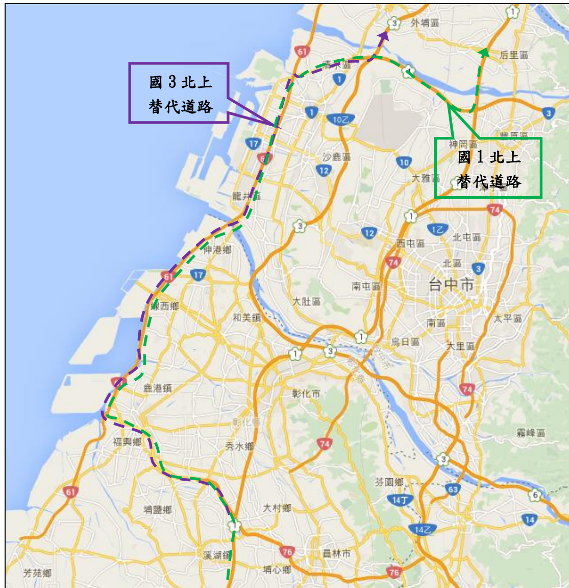
國 1 彰化交流道至彰化系統交流道間北上主線施工封閉交通改道建議圖-1