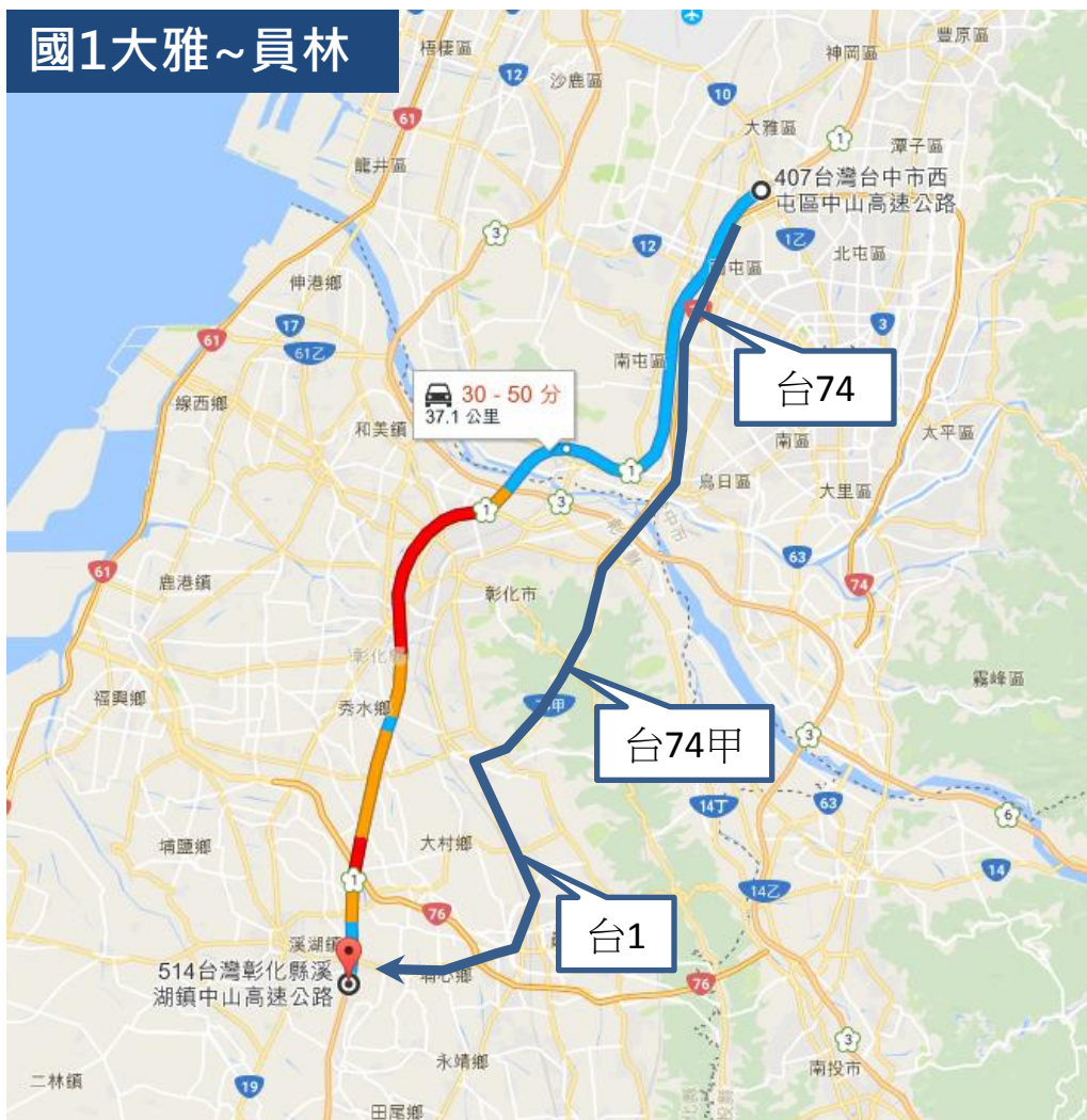
圖3 國1大雅至員林南下國道與省道旅行時間