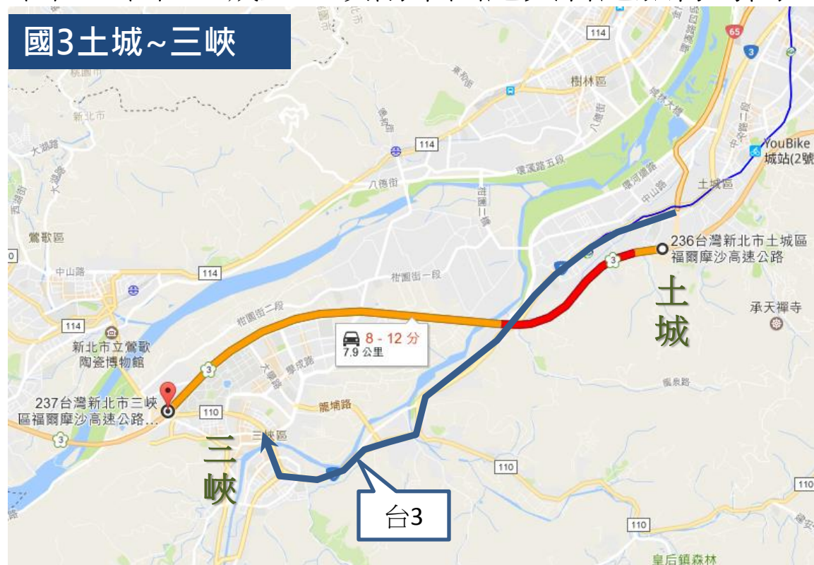
圖2-1 國3土城至三峽南下國道與省道旅行時間