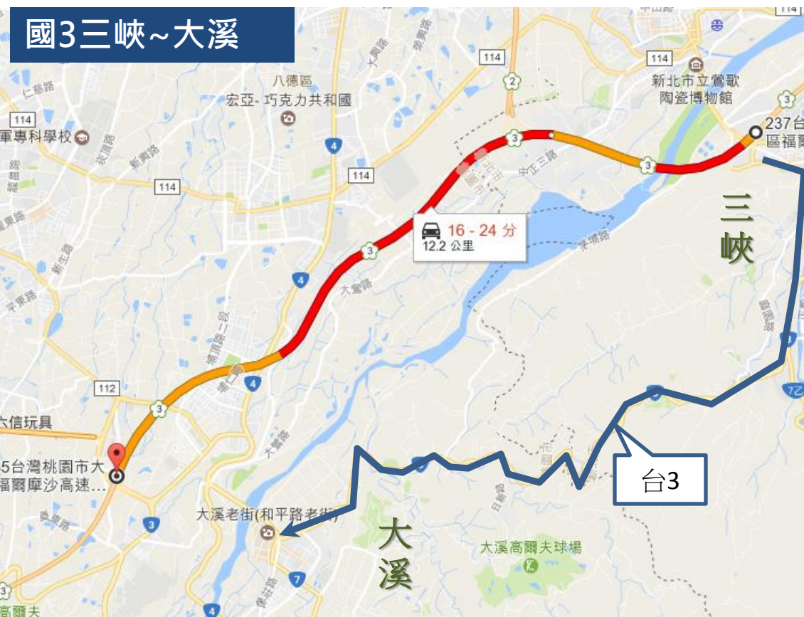
圖2-2 國3三峽至大溪南下國道與省道旅行時間