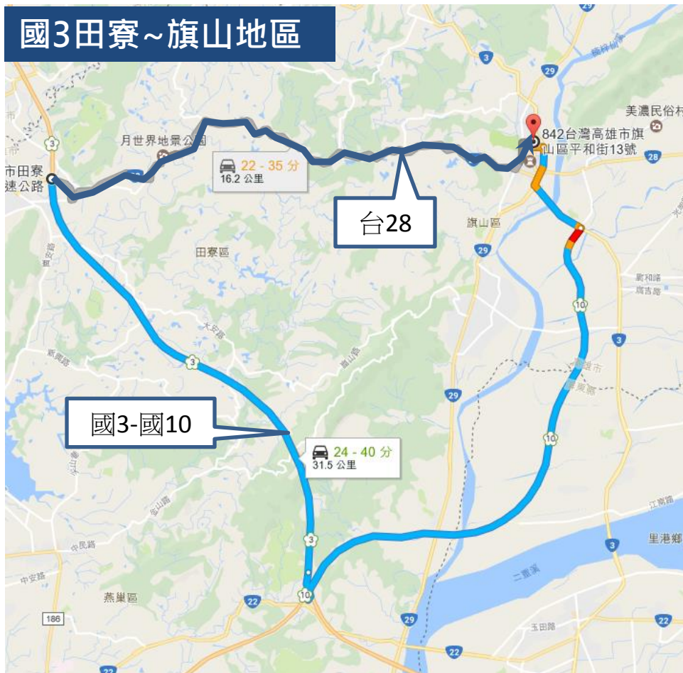
圖5 國3田寮至旗山地區國道與省道旅行時間