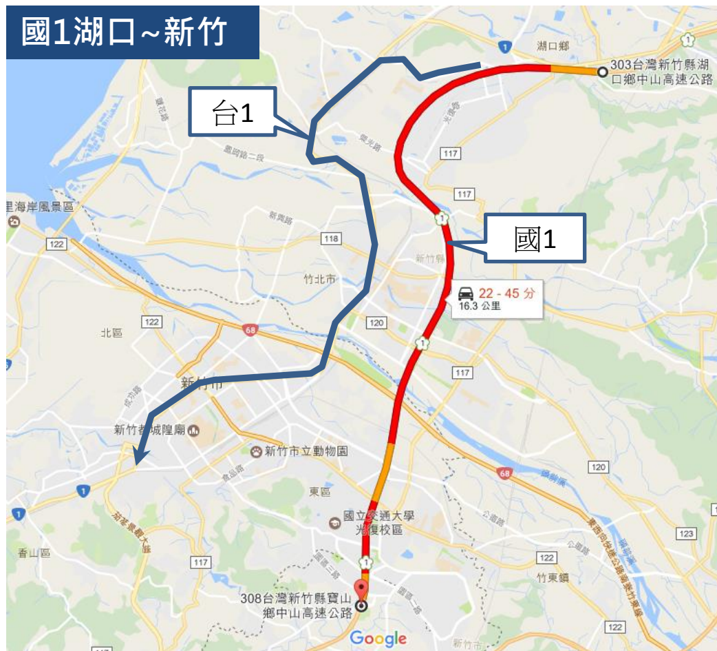
圖1 國1湖口至新竹南下國道與省道旅行時間