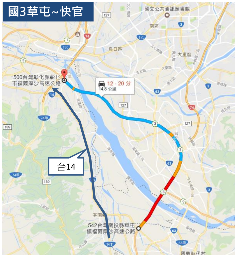
圖4 國3草屯至快官北上國道與省道旅行時間