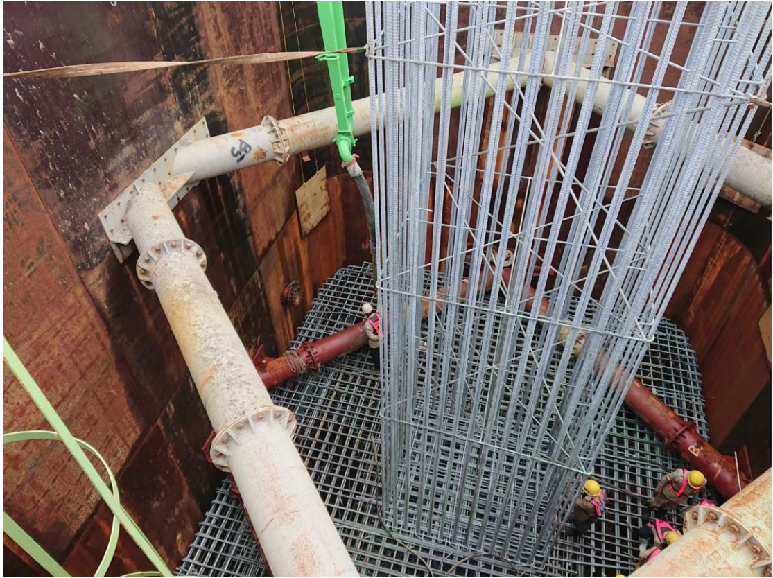
7_P15 基礎開始澆置混凝土