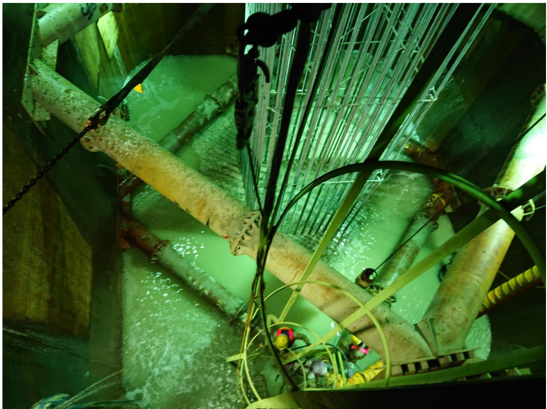
8_P15 鋼箱圍堰基礎混凝土澆置完成