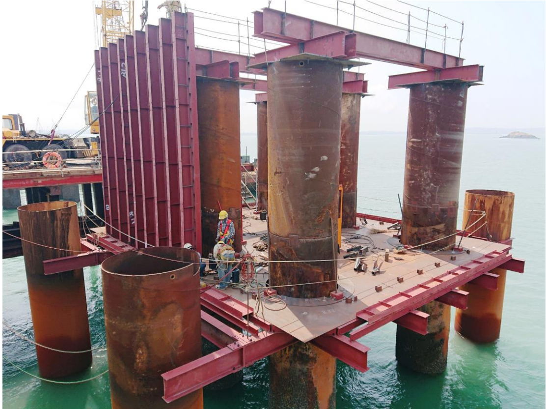
1_P15 鋼箱圍堰第 1 層側板組立