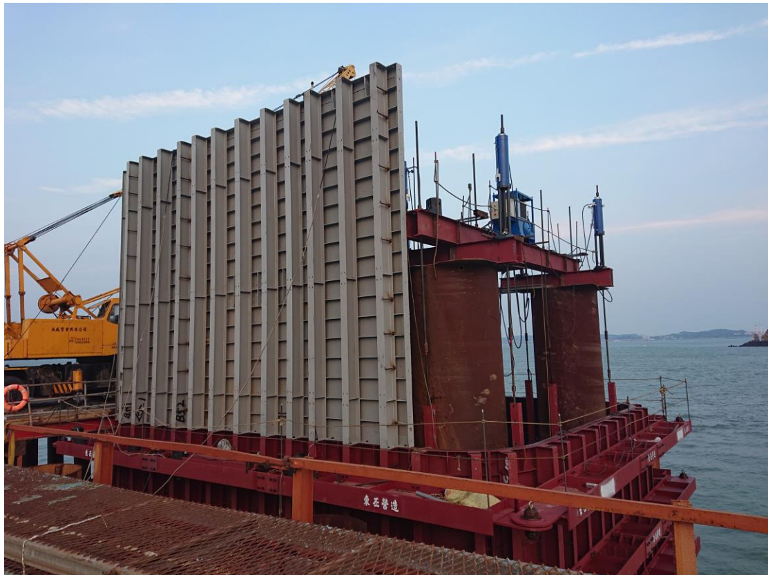
2_P15 鋼箱圍堰第 2 層側板組立