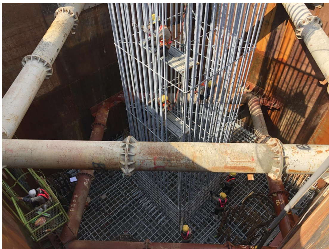
6_P15 鋼箱圍堰內鋼筋綁紮作業