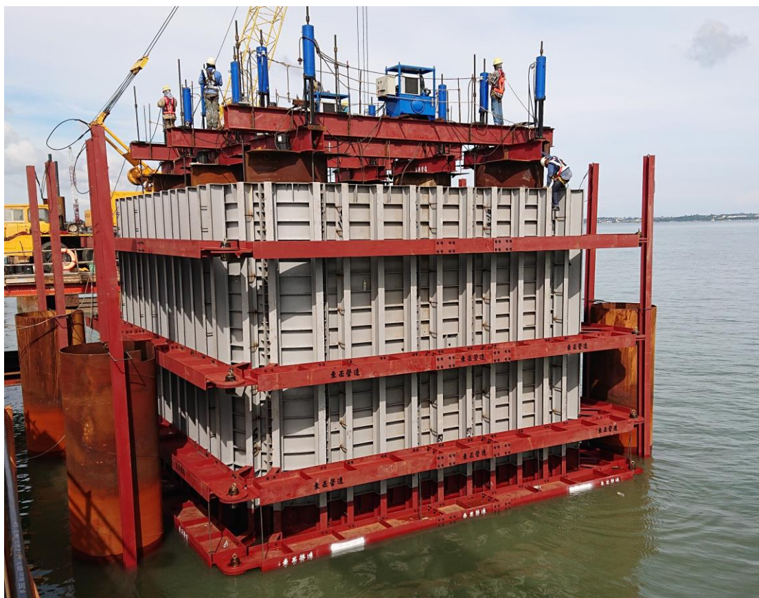
3_P15 鋼箱圍堰下放作業