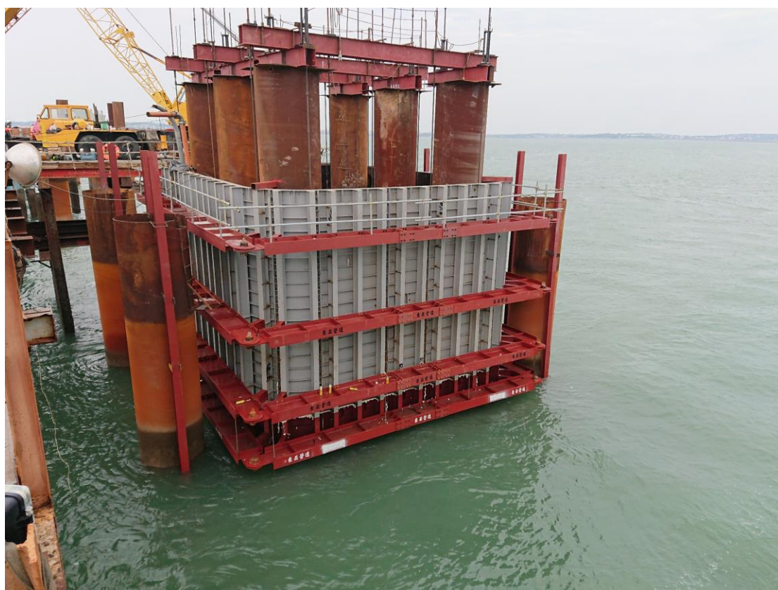
4_P15 鋼箱圍堰下放完成