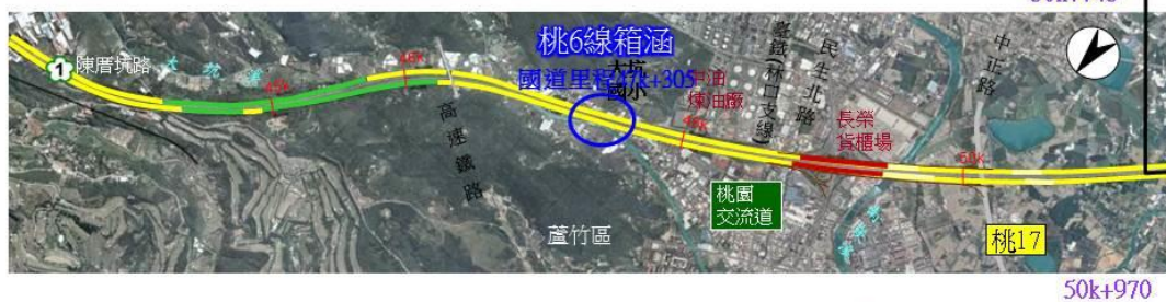
桃6線箱涵拓建工程位置示意圖