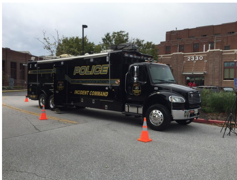
圖 15 電子通訊及簡易應變中心車