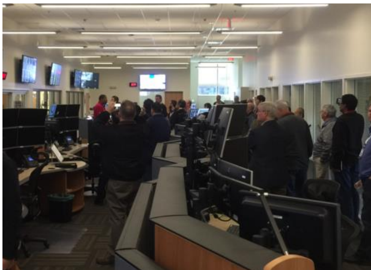
圖 11 交控中心內部

目前國道交控中心並未與公警合署辦公，緊急時需要透過電話或網路通訊軟體等方式聯繫，資訊之掌握度常有落差，後續如有可能應考慮接合 ETC 系統並合署辦公並接合之可行性。