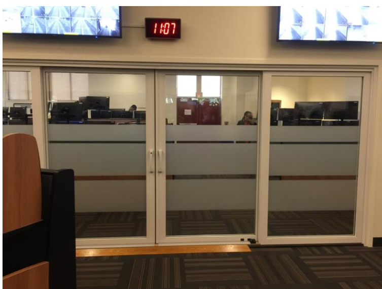
圖 12 交控中心內部之警務室