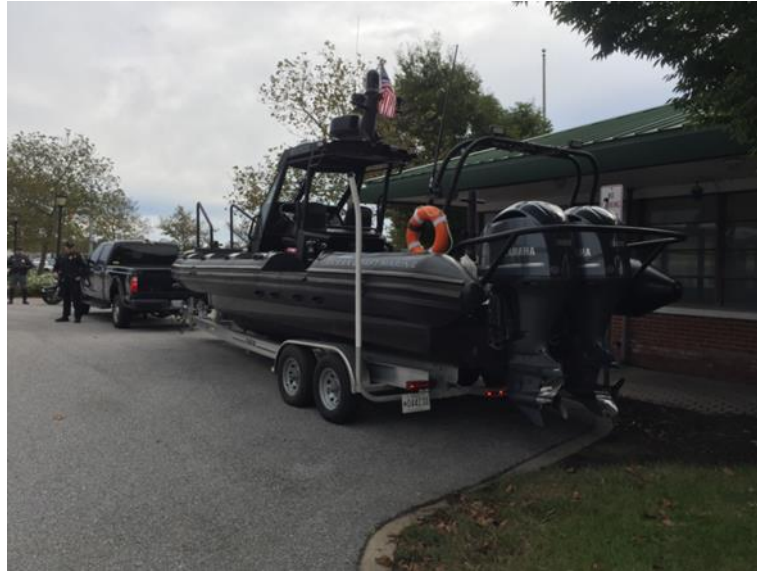
圖 13 海上救援艇

另外麥克亨利堡隧道交控中心管理之範圍除隧道之相關設施與行駛於隧道內部之交通之外，尚包含隧道周邊之水域，因曾有恐怖攻擊發生，因此也備有海上救援艇(圖 13)，也有警察巡邏隊機槍的配屬(圖 14)，再加上移動式的電子通訊及簡易應變中心車(圖 15)，以便必要時處理水域內之突發況。