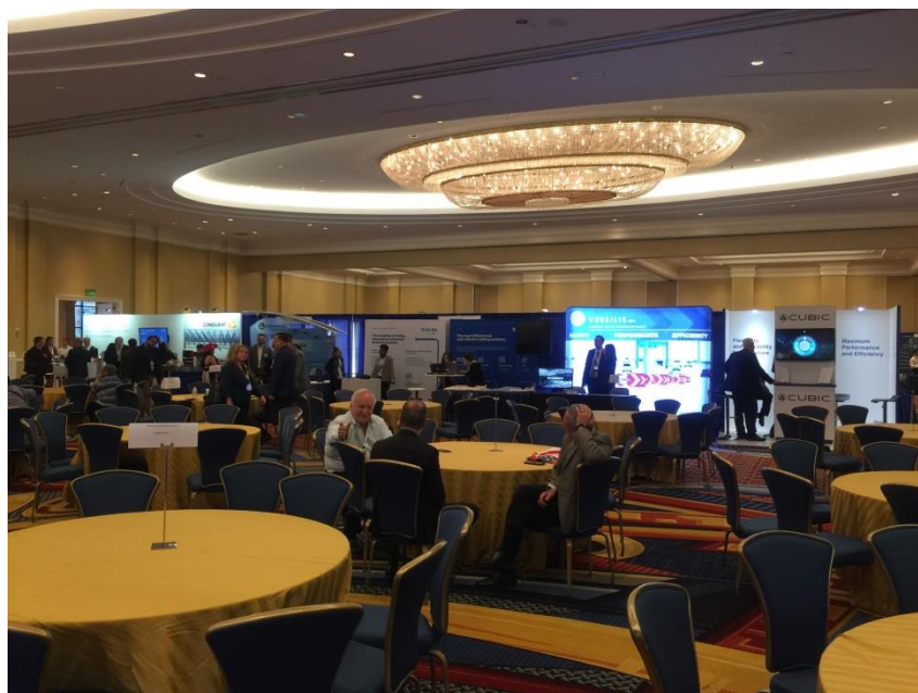
圖 4 展覽會場

在另一場內並採全時進行之攤位展覽(Exhibitors)亦為年會中之重頭戲，各家公路管理設施供應商、相關單位以攤位展示其產品並提供現場解說，會場並備有小圓桌供廠商與參觀者交流用。本人除參與之場次熱門之運輸領域科技發展座談外，並利用其他時間至展覽會場參觀，本次在展覽場地看到許多先進之動態地磅及車輛偵測設備等，並與各參展單位有進行交流，增進不少見聞。