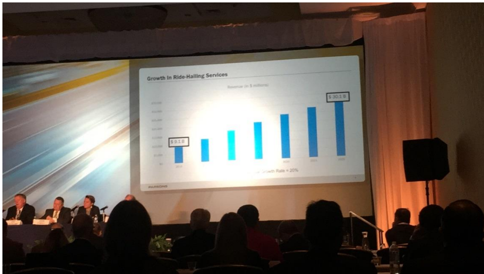
圖 6 智慧車與各項最新科技簡報

資保護及安全相關(Operations Track)等。本人參與之場次主要為智慧車與各項最新科技相關之場次(圖 6)。