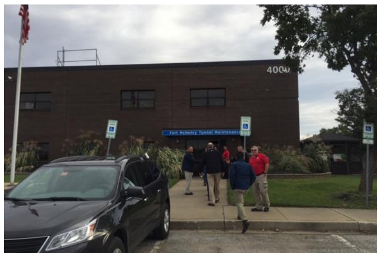
圖 7 隧道維護辦公室外觀

圖 7 為維護辦公室外觀，維護辦公室主要工作即是隧道的清洗、維護等工作和工務段的角色類似。