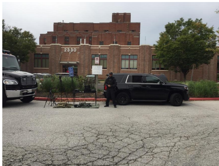
圖 14 警察巡邏隊(配機槍)