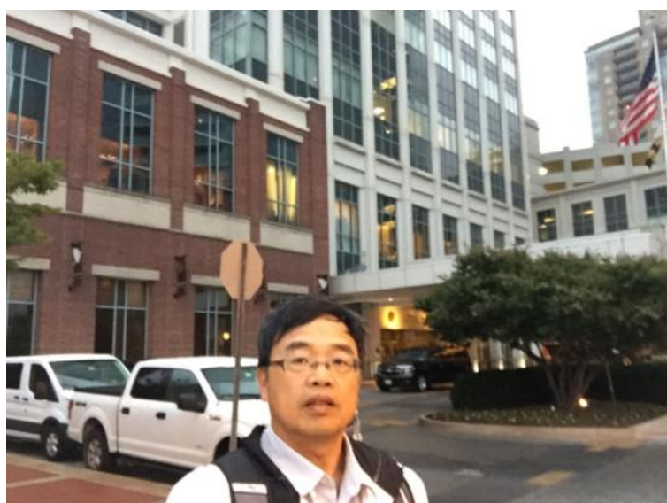
圖 1 會議舉辦地點 Baltimore Marriott Waterfront 飯店

本人於 10 月 14 日上午 8 時至會場辦理報到手續，並準時參加事先報名之技術參觀，前往麥克亨利堡(Fort McHenry Tunnel)之交管中心進行參訪。10 月 14 日之年會活動多為歡迎活動，除上午之技術參觀外，於當日下午辦理初次參加者之歡迎會，以及晚間之歡迎晚宴。圖 1 為本人攝於本次舉辦年會之 Baltimore Marriott Waterfront 飯店外。