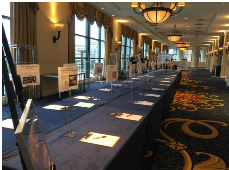
圖 19 與會者留言區