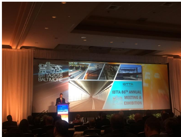
圖 2 大會開幕式演說

亞伯達省野火事件時的消防隊長(現已退休)，演說主題講述火災發生的原因、演變及消防隊的因應作為演說主要強調防災訓練對於緊急應變之重要性；其後為一般發表場次 (General Session)，第一場主題為馬里蘭州交通廳之運作模式、組織內外部如何合作，及帶來的效益，第二場主題為傑出收費獎頒獎及獲獎者介紹。本次獲獎者包含加拿大哈利法克斯大橋、美國北卡羅萊納州公路收費系統、美國維吉尼亞州交通廳、美國佛羅里達州公路收費監控系統等。最後一場次則為當前最熱門之運輸領域發展座談會，主題為因應科技之發展，馬里蘭州交通廳對於無人駕駛/自動駕駛之智慧車(Connected and Automated Vehicles, CAV)，如何落實智慧化運輸系統(ITS)之發展方向，包括透過車機之安裝蒐集交通數據提供用路人更加舒適之行車服務、調整車輛型式提供更大交通容量，並點出最主要的關鍵：當智慧車科技不斷發展，道路的維護、設計和管理要如何做？才能因應智慧車自動化、無人化行駛的需求？為智慧車輛科技發展之餘最需反思的問題。