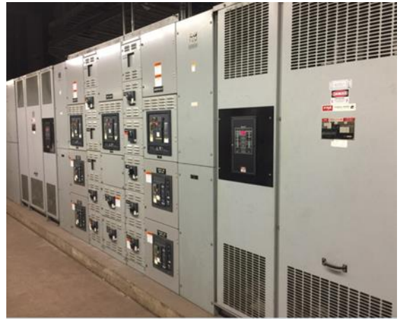
圖 8 隧道機房內部設施