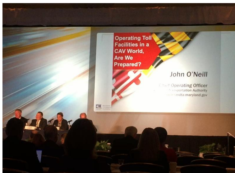
圖 3 一般場次演說