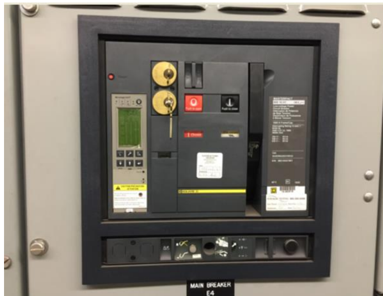
圖 9 機電設備之雙重保險開關