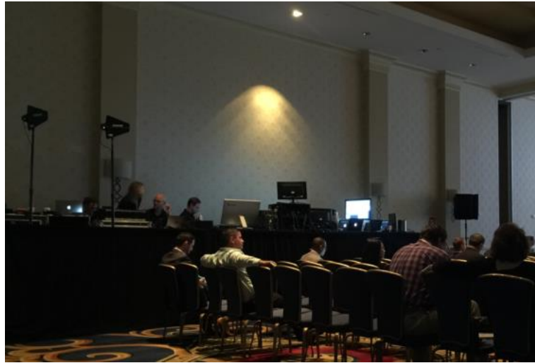
圖 18 發表場地之音控設備