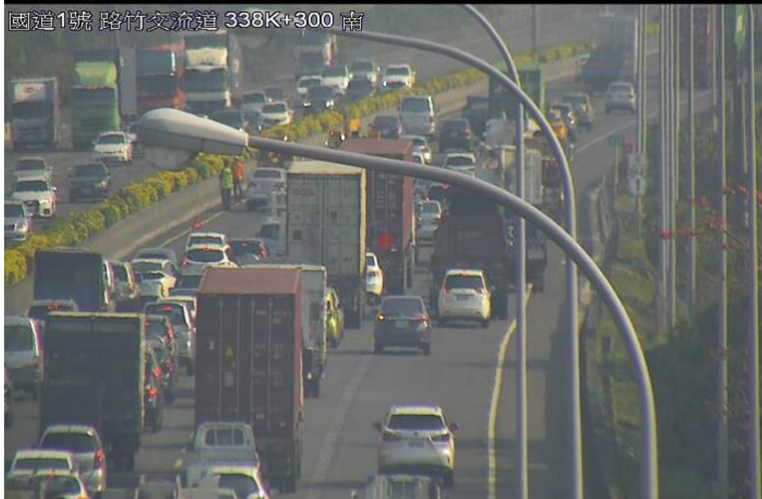
國 1 南下 339K，2 小客車追撞，回堵約 1k