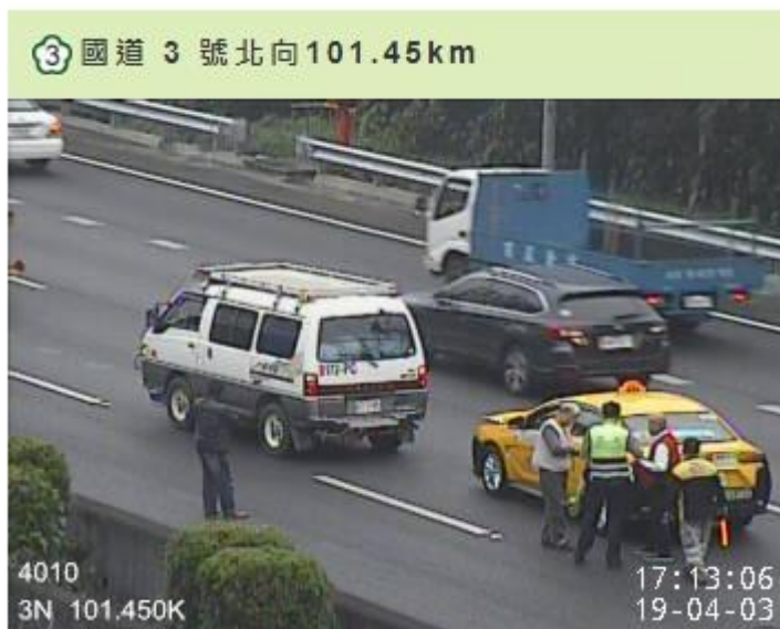
圖 1.事故影響國道，回堵 3 公里