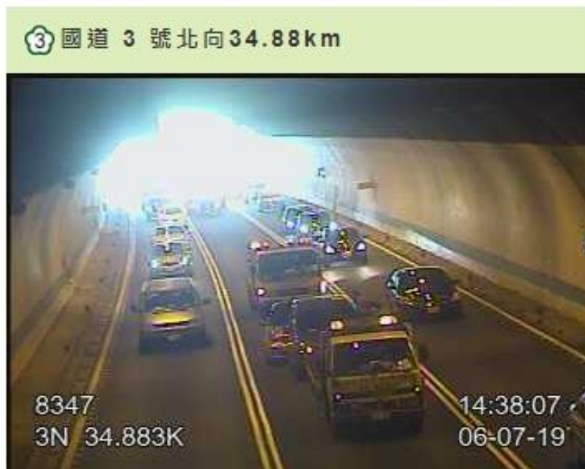
圖 1：國 3 北向 35 公里發生 5 輛小車追撞佔用中線車道回堵 3 公里