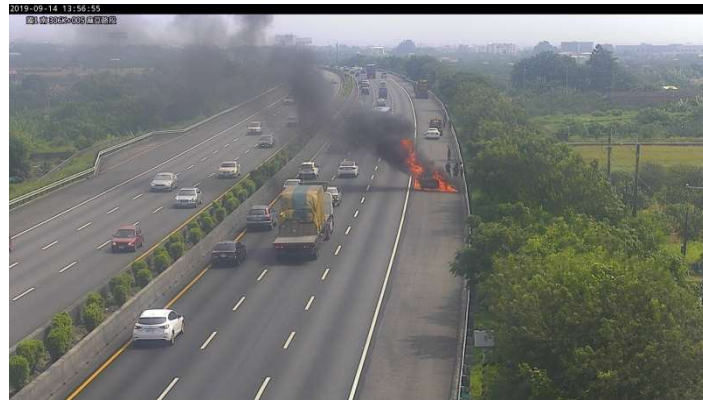
圖 2：13 時 57 分國 1 南向 306K 外側路肩 1 小客車火燒車，回堵 5 公里