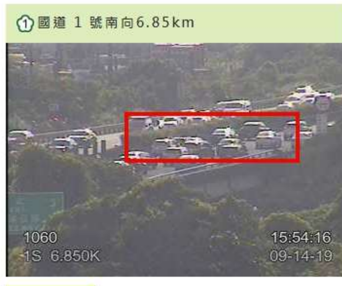
圖 3：15 時 53 分國 1 南向 7.6K 內側車道 5 小客車追撞事故，回堵 2 公里