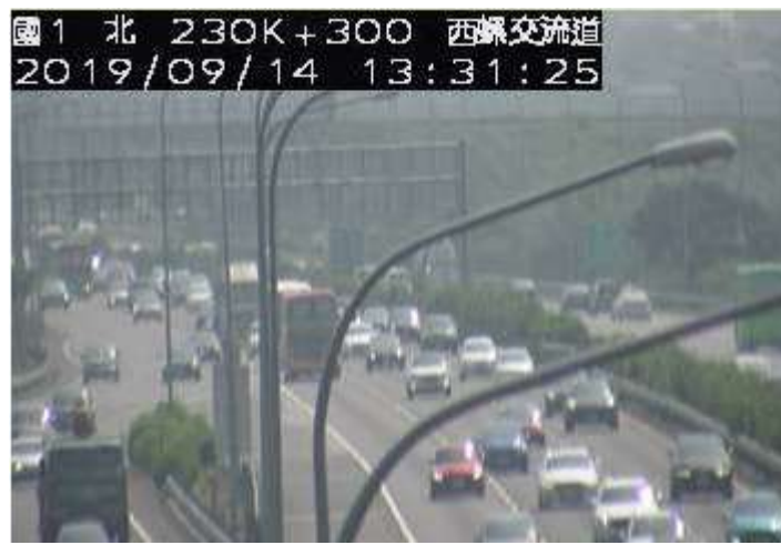
圖 1：12 時 13 分國 1 北向 231K 內外車道 2 小客車及 1 小貨追撞事故，回堵 9 公里