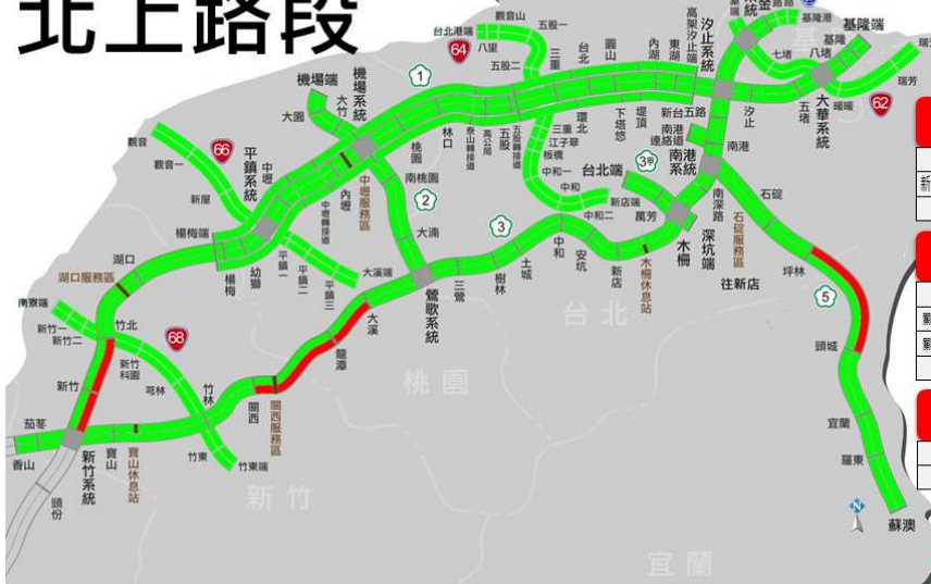
國一北上新竹系統至竹北