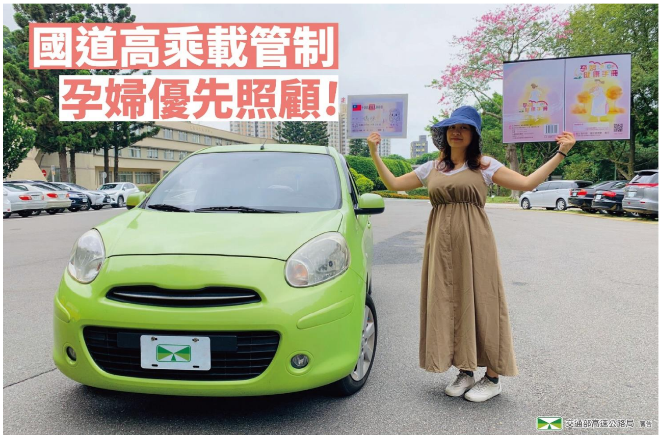
附圖 2、高乘載管制孕婦通行辦法