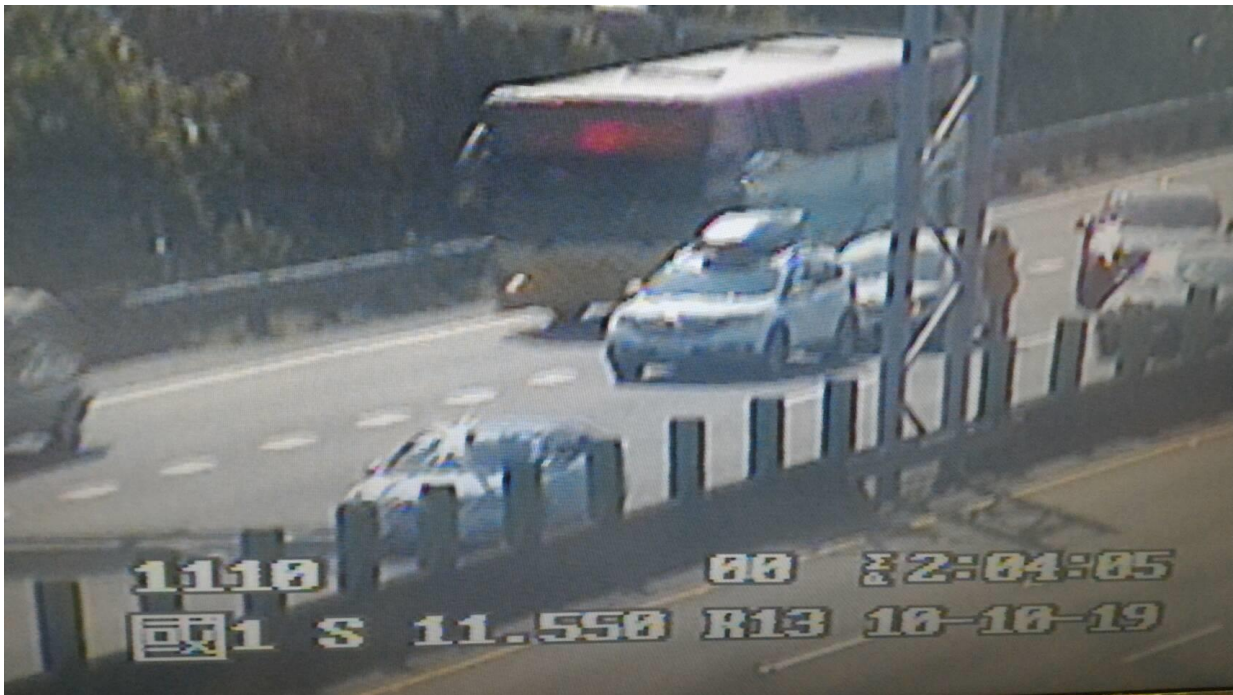
圖 2：國 1 南向 207K，2 小客車追撞占內車道，回堵約 2 公里