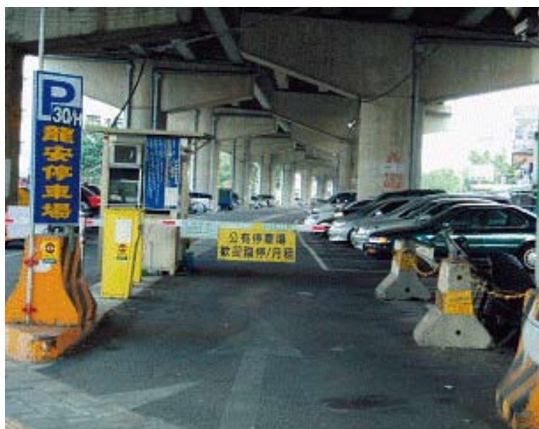
圖 2 12k+162~12k+600高架橋下出租停車場照片