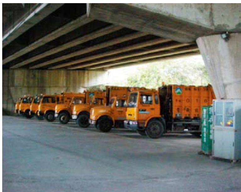
圖 3 52k+200~240橋墩間停放環保車