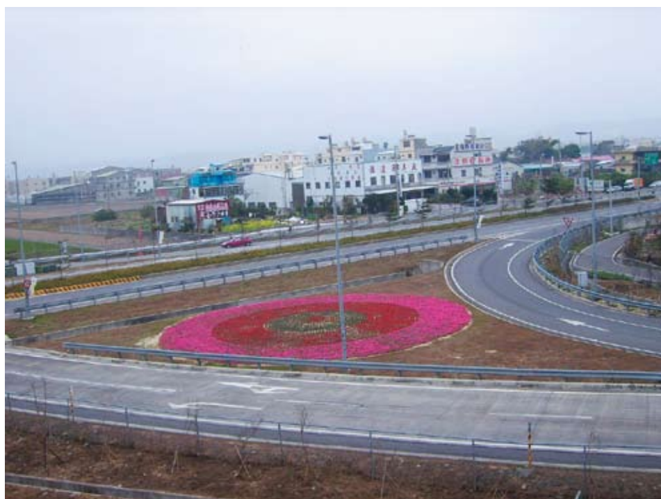
苗栗縣政府認養國3苑裡交流道三角槽化島照片