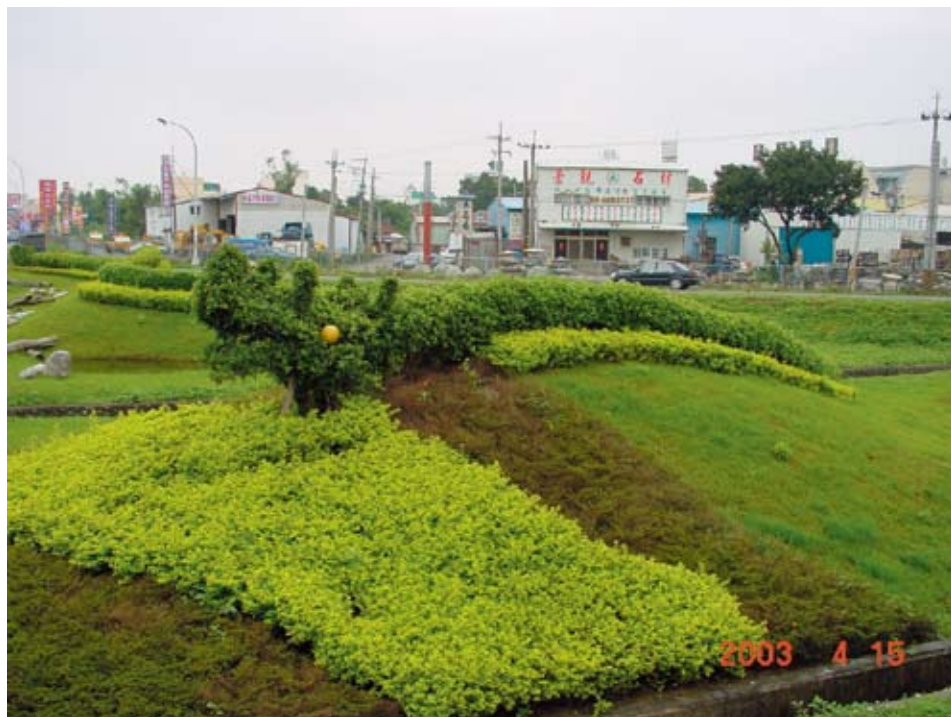
龍潭鄉公所認養國3龍潭交流道照片

四、開放國道高速公路交流道、邊坡及高架橋下景觀認養，鼓勵公私機構、法人或非法人團體參與高速公路沿線景觀維護認養工作，不僅可改善國道景觀，並有助於增加公共空間、提升鄰近社區生活環境品質；目前辦理認養有台塑石化公司等23個單位。