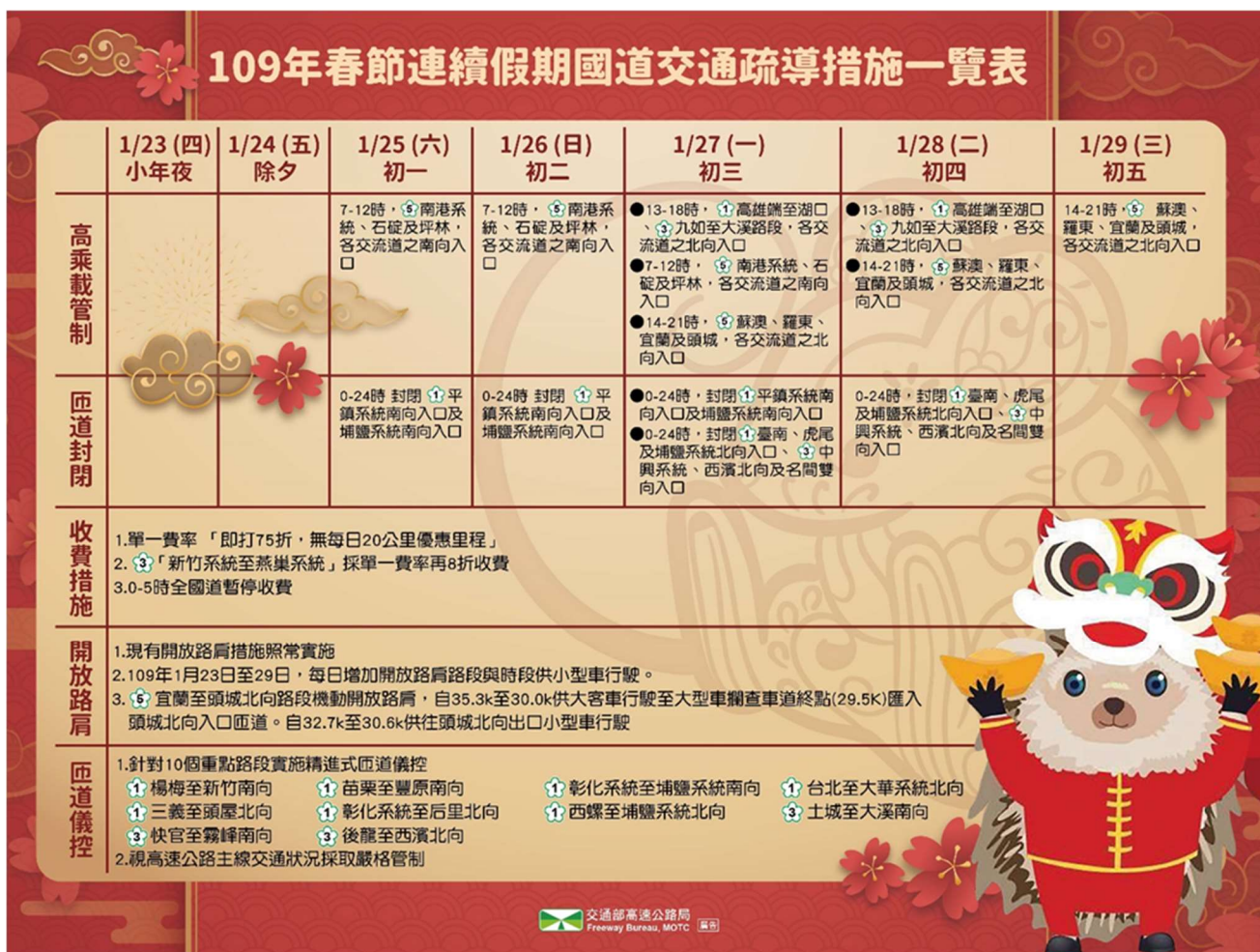
附圖 3：109 春節疏導一覽表懶人包