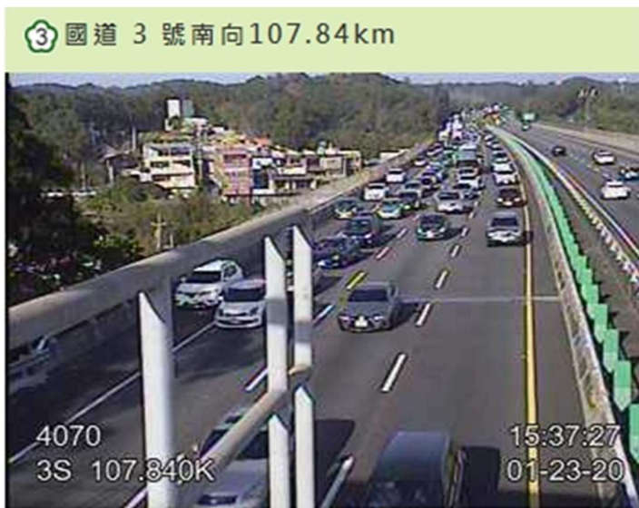
附圖 1.國 3 南向 107.8 公里外線 2 小車追撞事故,無傷亡,回堵 7 公里。