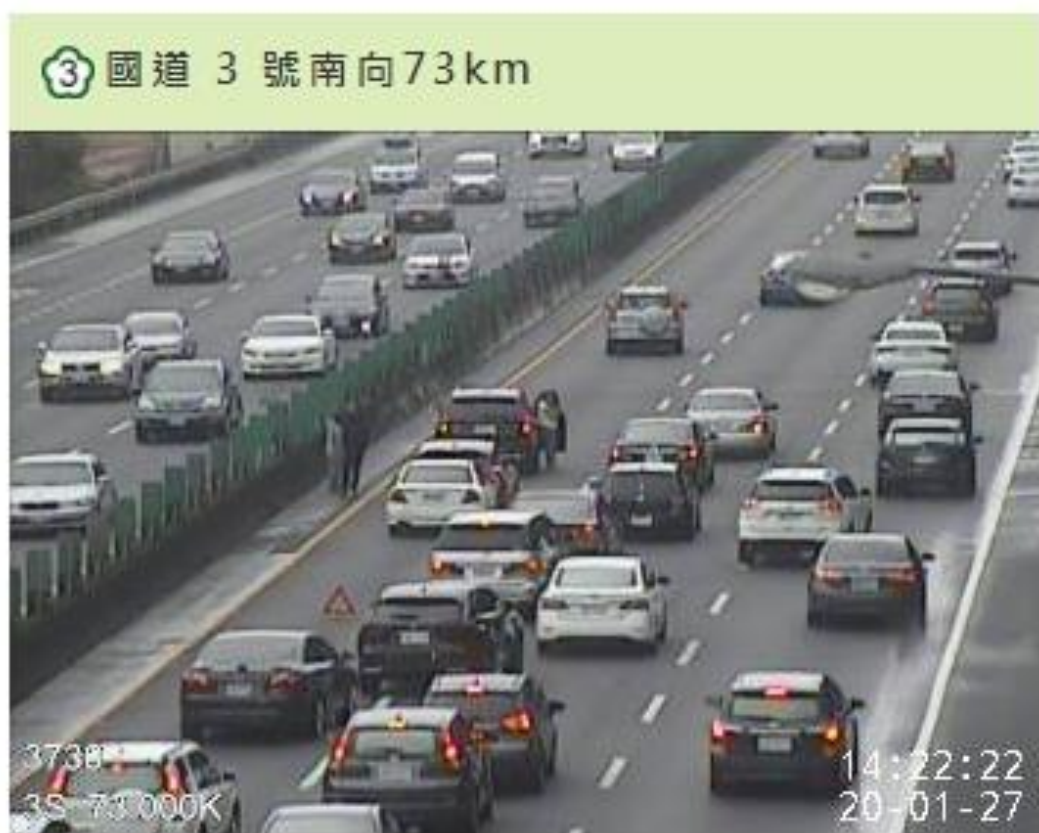
圖 2.14 時 21 分國 3 南向 73.2 公里發生 2 小車追撞回堵 3 公里