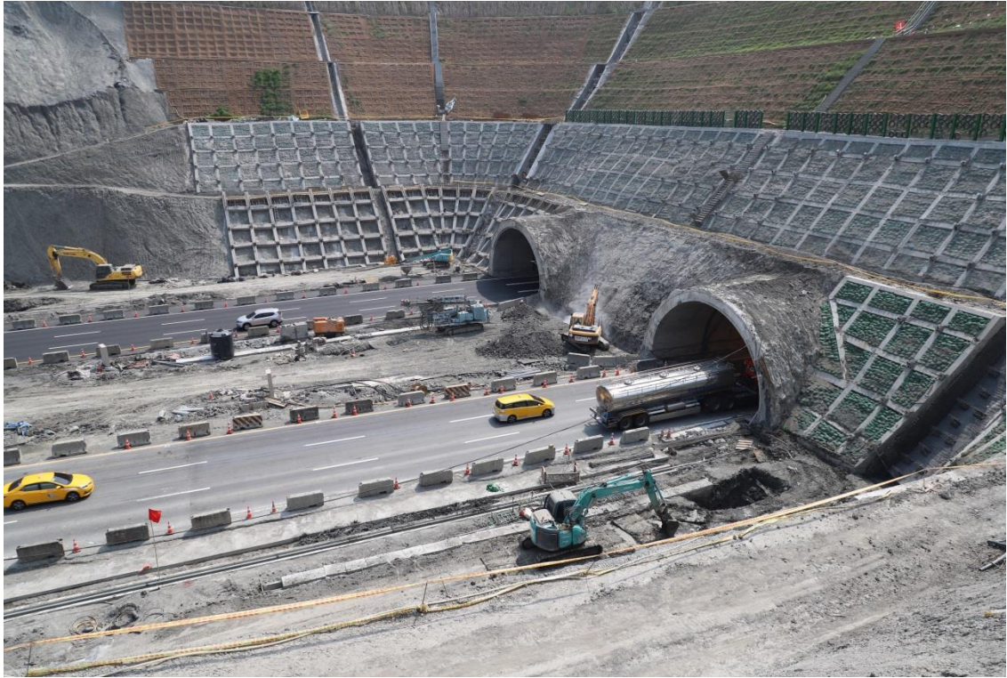
圖 3 邊坡最後一階坡腳處理