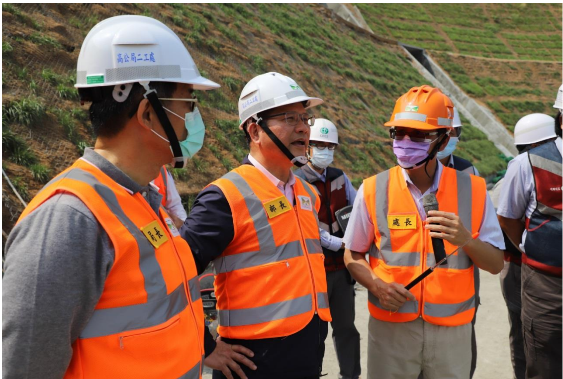
圖 6 高公局二工處處長向部長說明施工現況