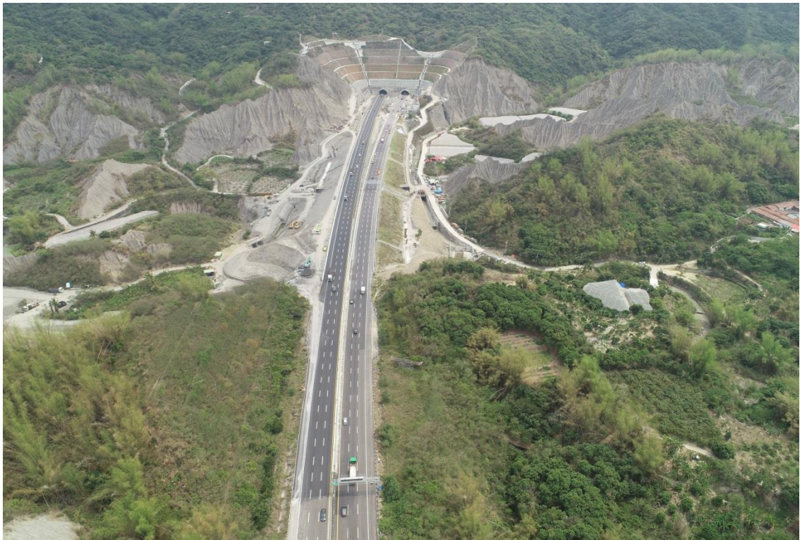
圖 1 本工程施工全景，已接近完成