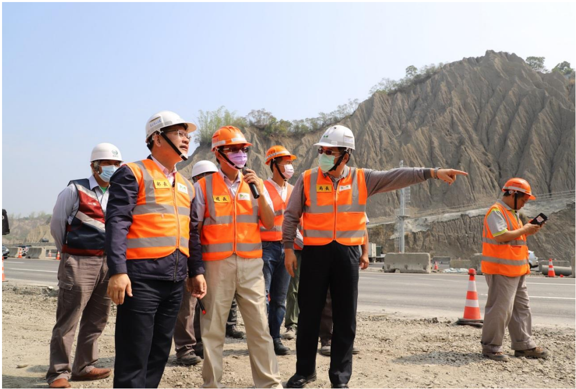
圖 5 高公局局長向部長說明施工現況