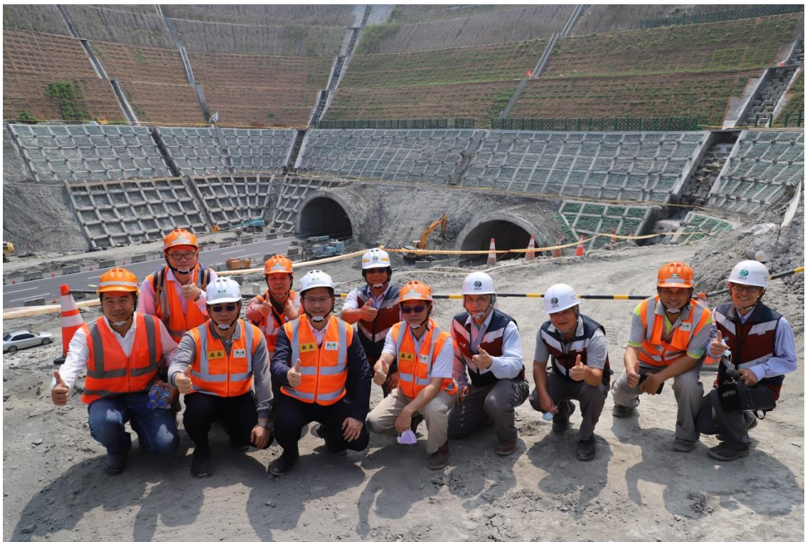
圖 8 部長期勉施工團隊合影留念-2