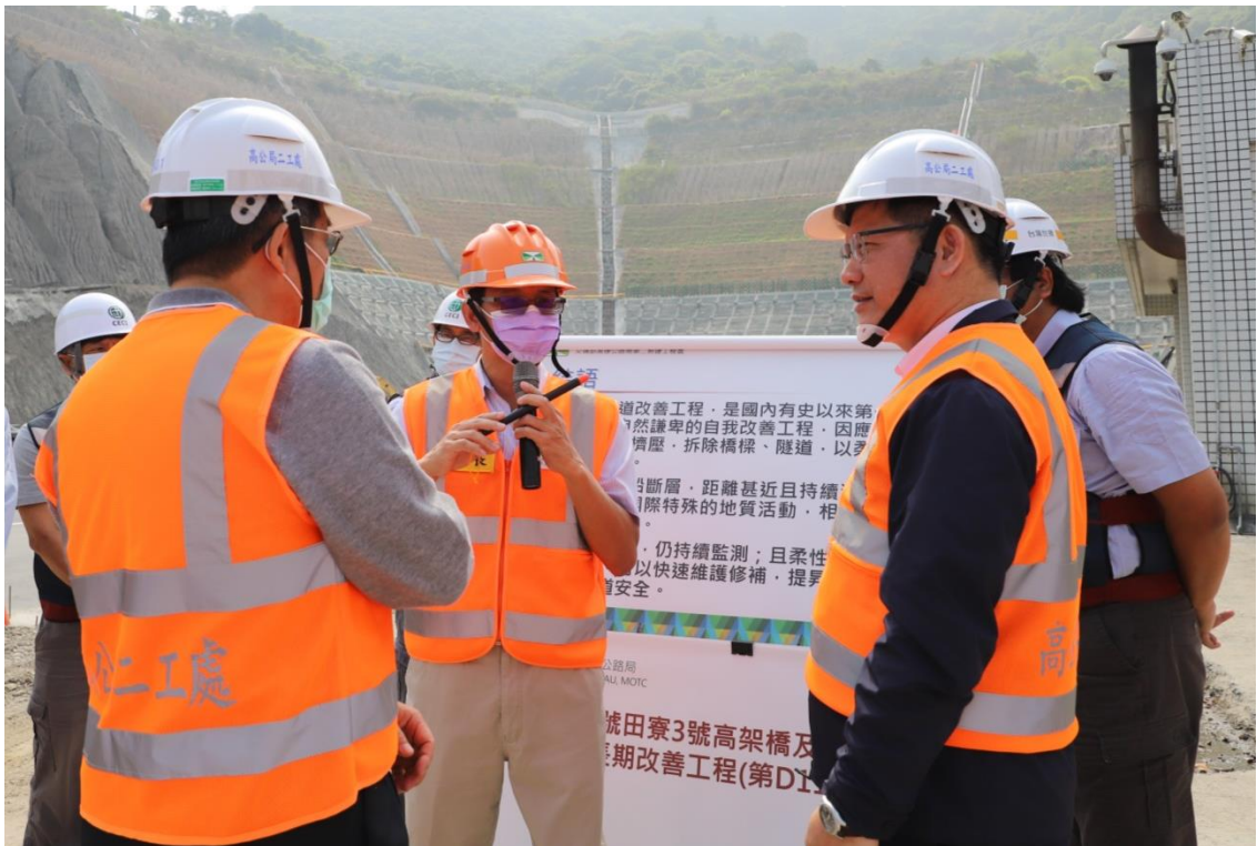
圖 4 高公局二工處處長向部長簡報