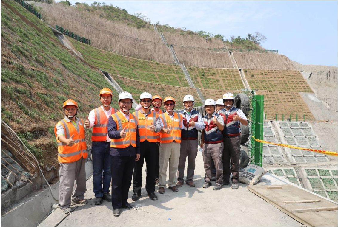
圖 9 部長期勉施工團隊合影留念-3