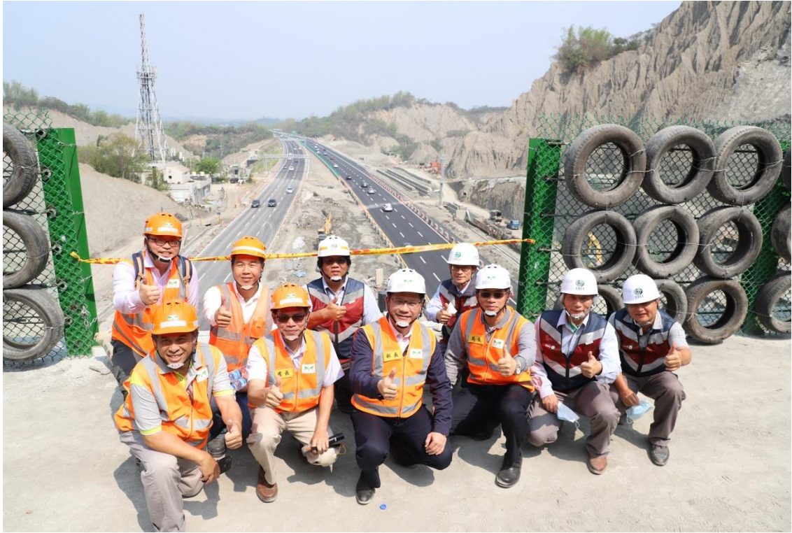
圖 7 部長期勉施工團隊合影留念-1