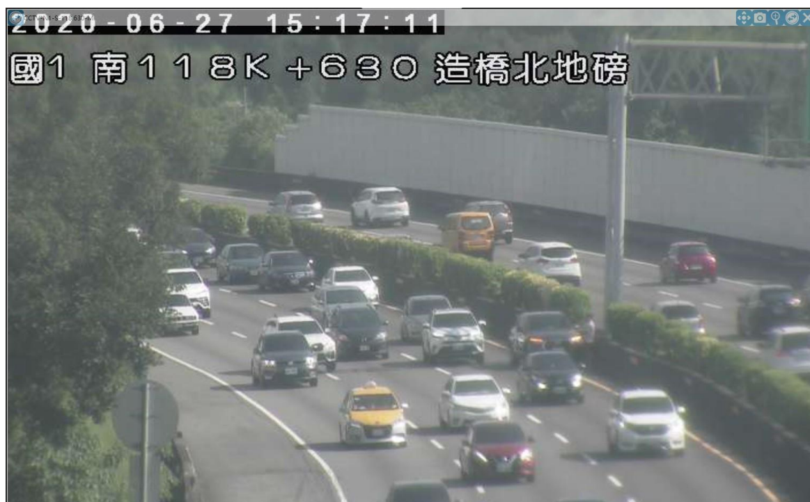
圖 2 國 1 北向 118.9 公里處發生 2 輛小客車追撞事故