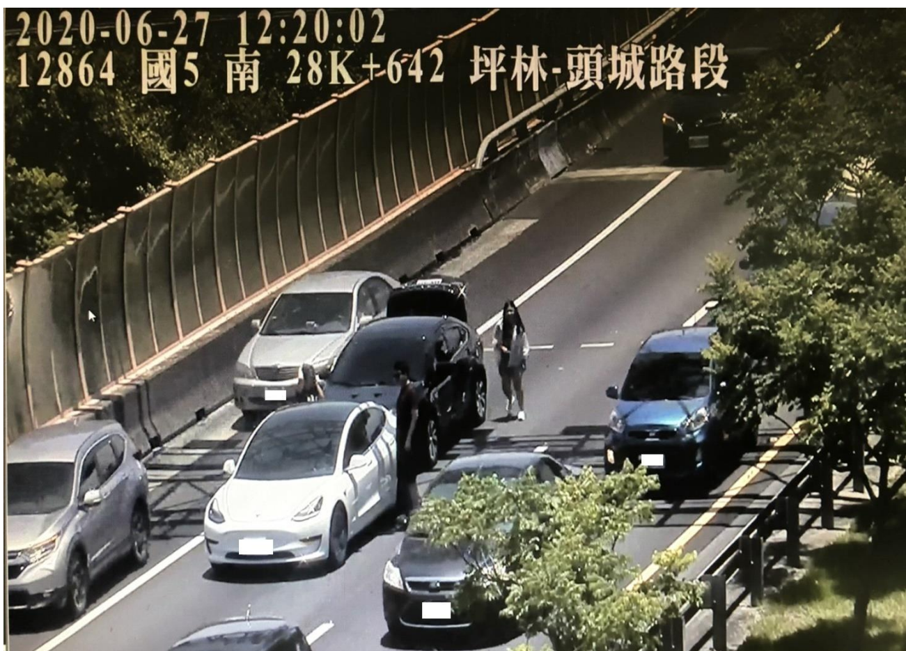
圖 1 國 5 北向 28.6 公里處發生 2 輛小客車追撞事故