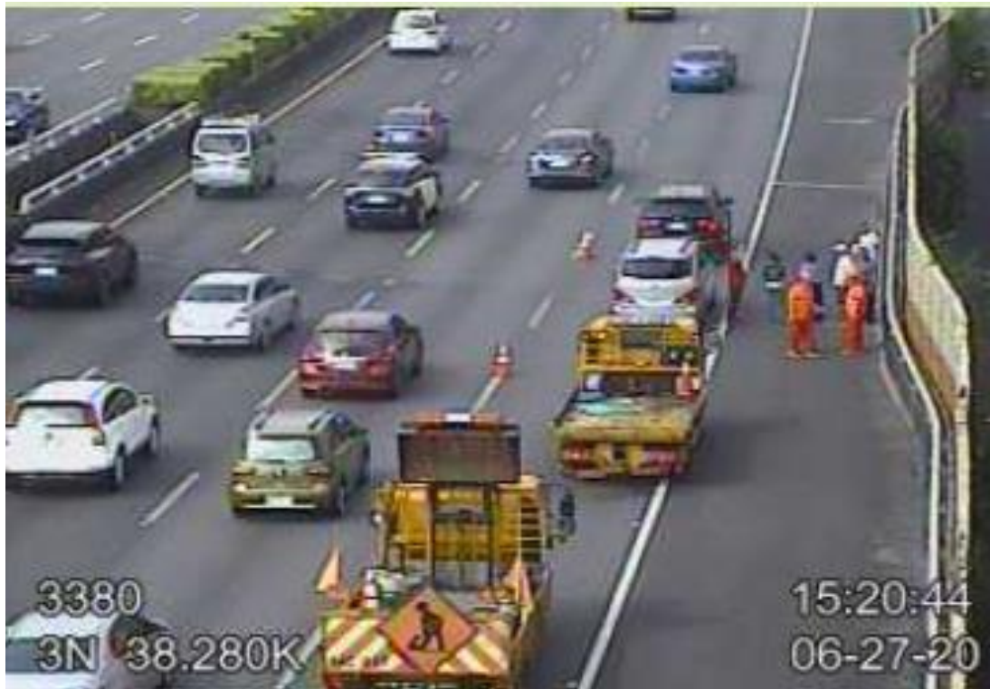
圖 3 國 3 北向 38.2 公里處發生 2 輛小客車追撞事故