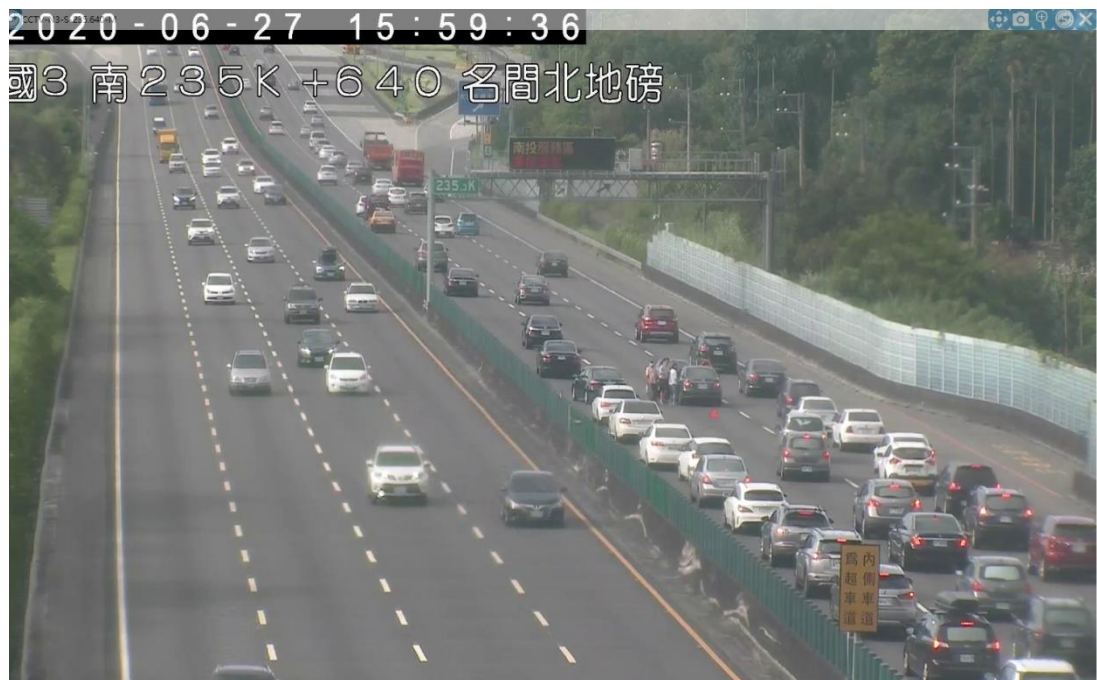
圖 4 國 3 北向 235 公里處發生 2 輛小客車追撞事故