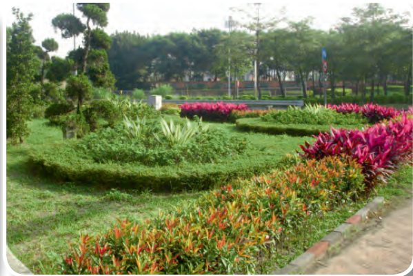
三峽鎮公所認養國道3號三鶯交流道（50k+585）