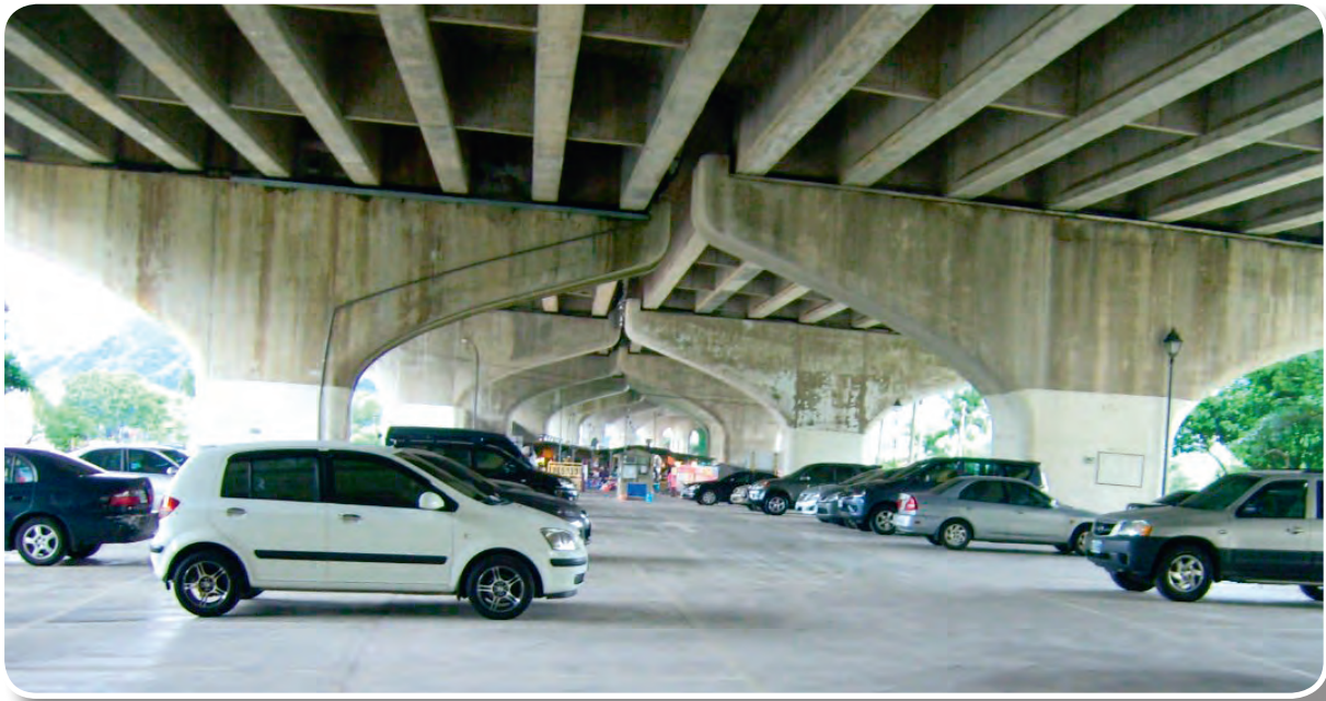
汐止市公所租用國道3號高架橋下（15k+181~15k+265）作為停車場使用

四、開放國道高速公路交流道、邊坡及高架橋下景觀認養，鼓勵公私機構、法人或非法人團體參與高速公路沿線景觀維護認養工作，不僅可改善國道景觀，並有助於增加公共空間、提升鄰近社區生活環境品質；目前辦理認養有三峽鎮公所等48個單位。