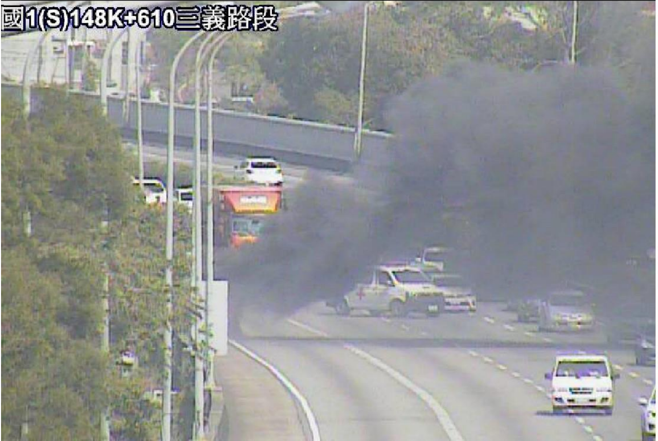
圖 1：12 時 43 分國 1 南向 148 公里 1 小客車起火事故占外車道，回堵 3 公里