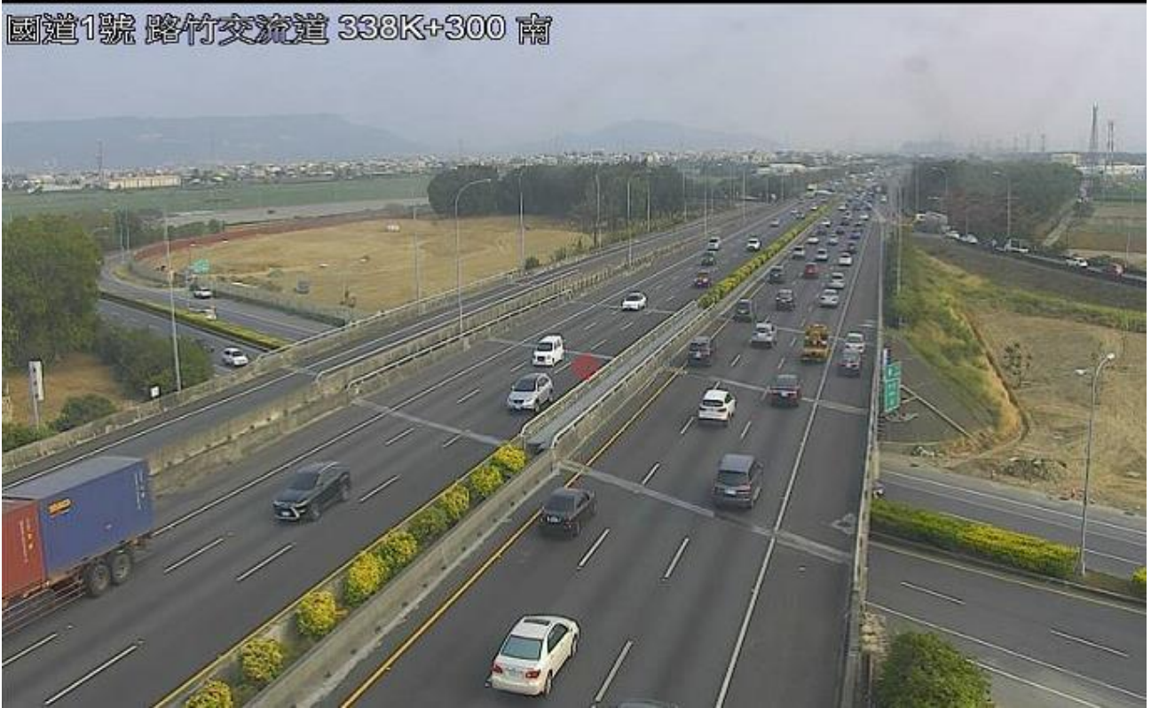
圖 3：16 時 06 分國 1 南下 338.3 公里 2 小客車追撞占用內車道，回堵約 2 公里

CCTV-N6-E-2.030-M 29.97 2019-03-01 16:37:06.72