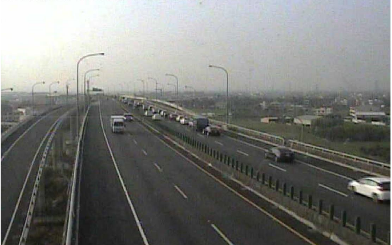
圖 4：16 時 15 分國 6 西向 2 公里 2 小客車追撞事故占外車道，回堵 1 公里