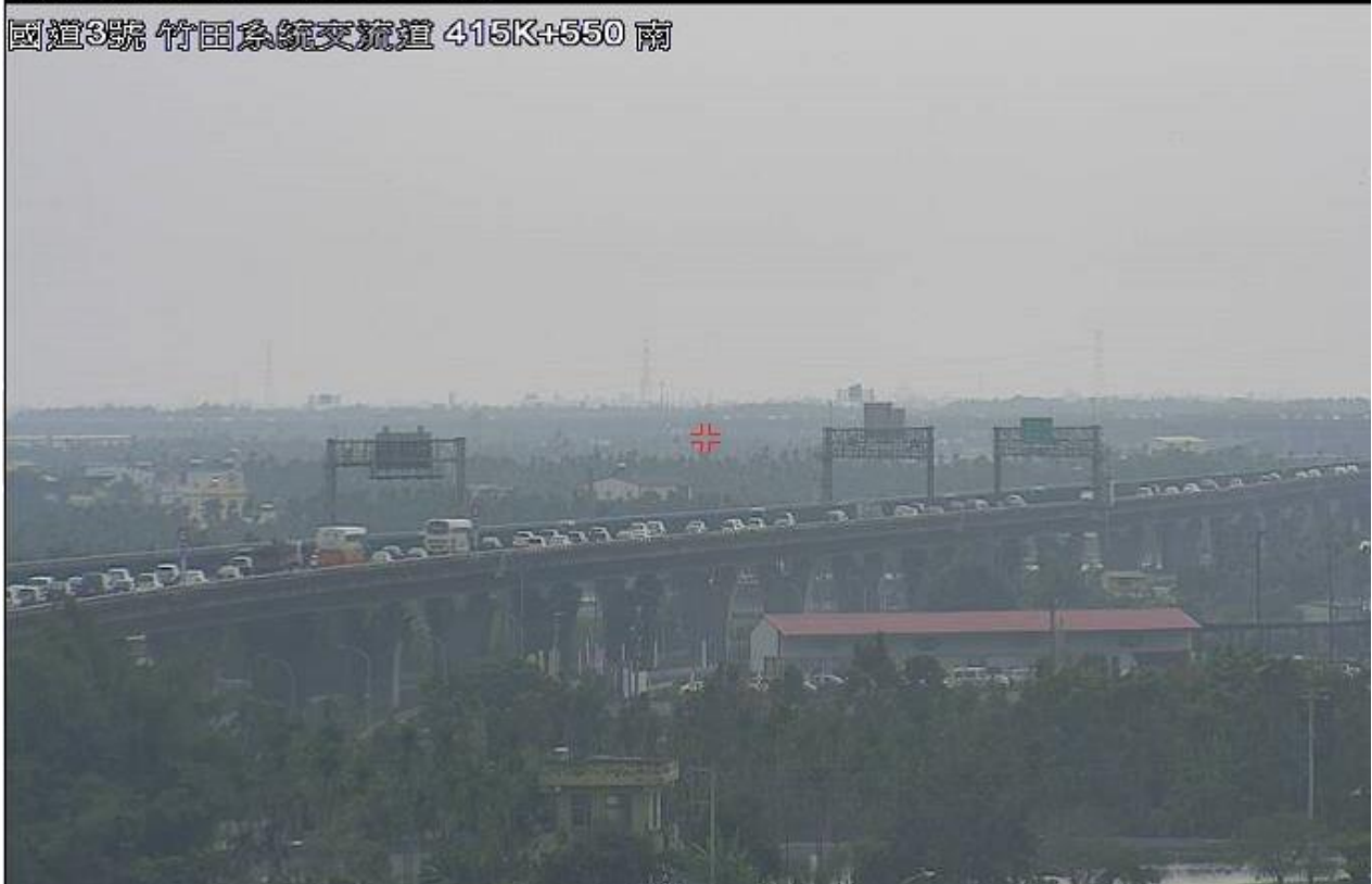
圖 2：13 時 34 分國 3 南下 417.7 公里 3 小客車追撞占用內線，回堵約 3 公里