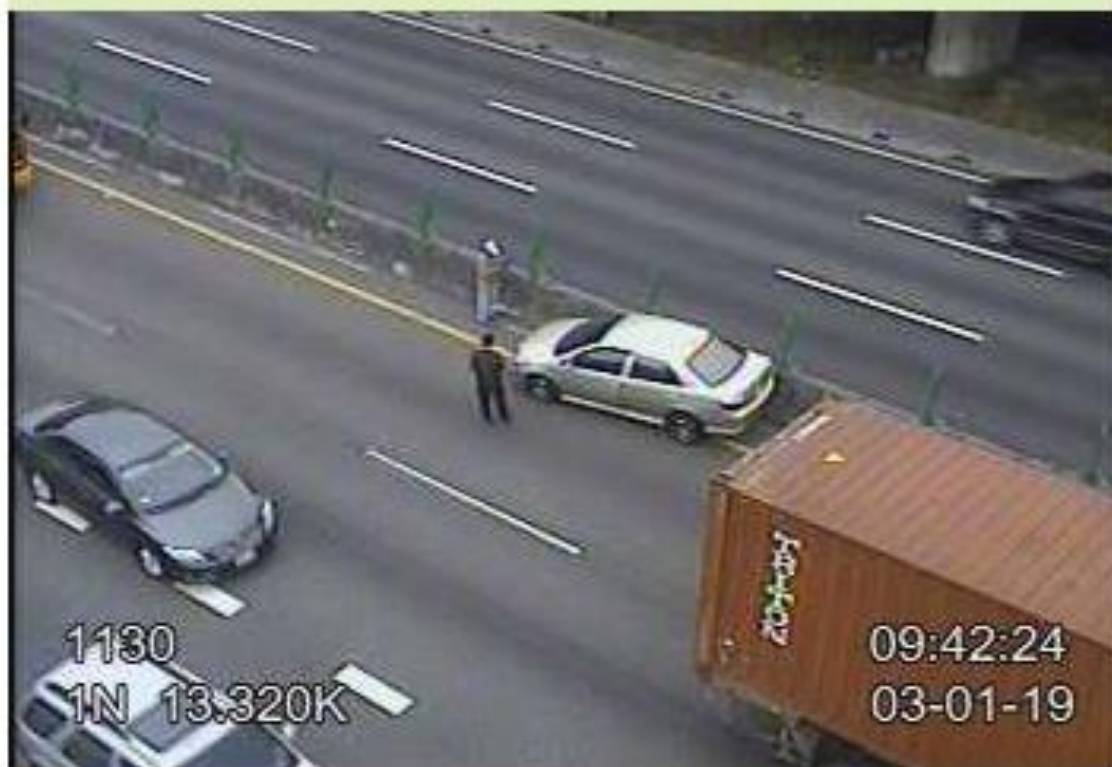
圖 2：9 時 41 分國 1 北向 13.3 公里內 2 線 1 聯結車+1 小車追撞事故，回堵 5 公里