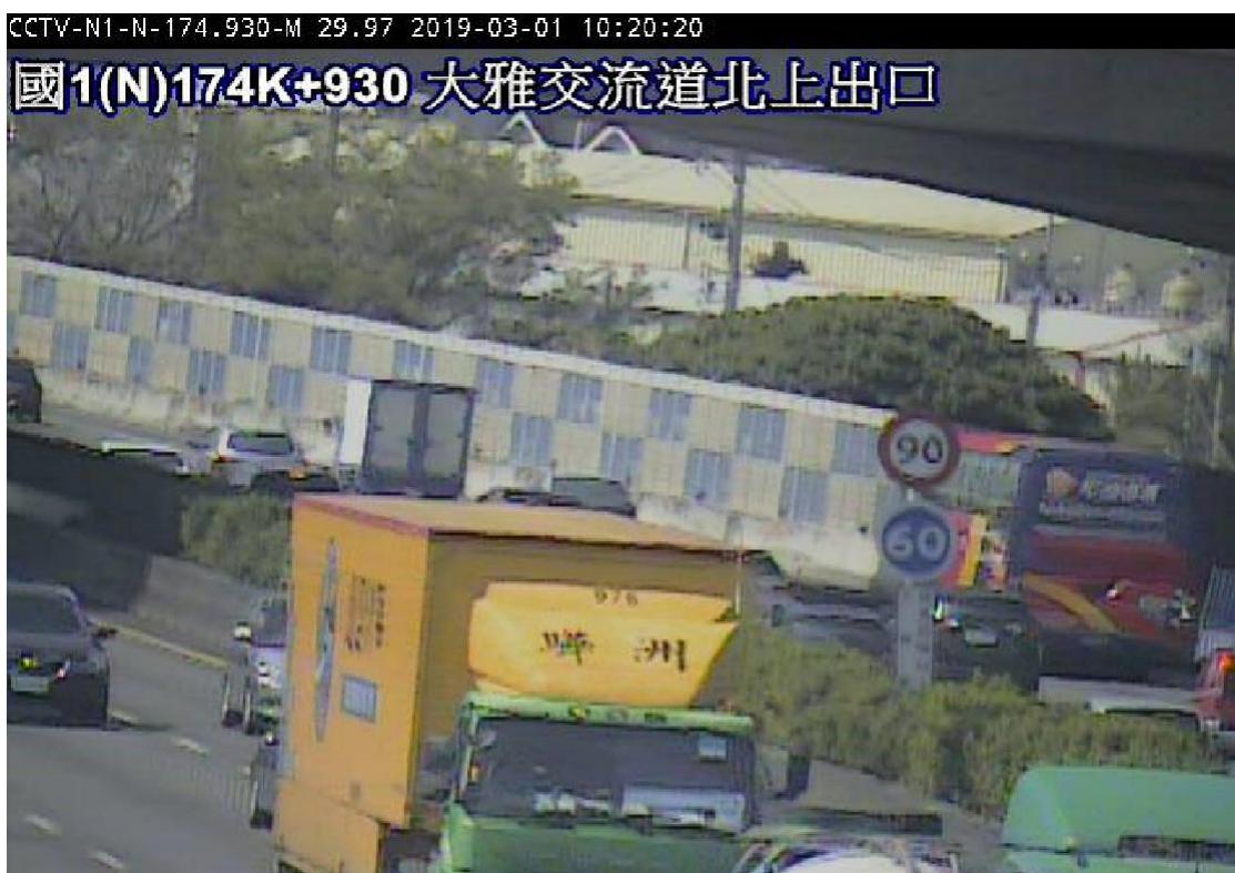
圖 4：9 時 57 分國 1 南向 175 公里 2 小客車追撞占內車道，回堵 3 公里