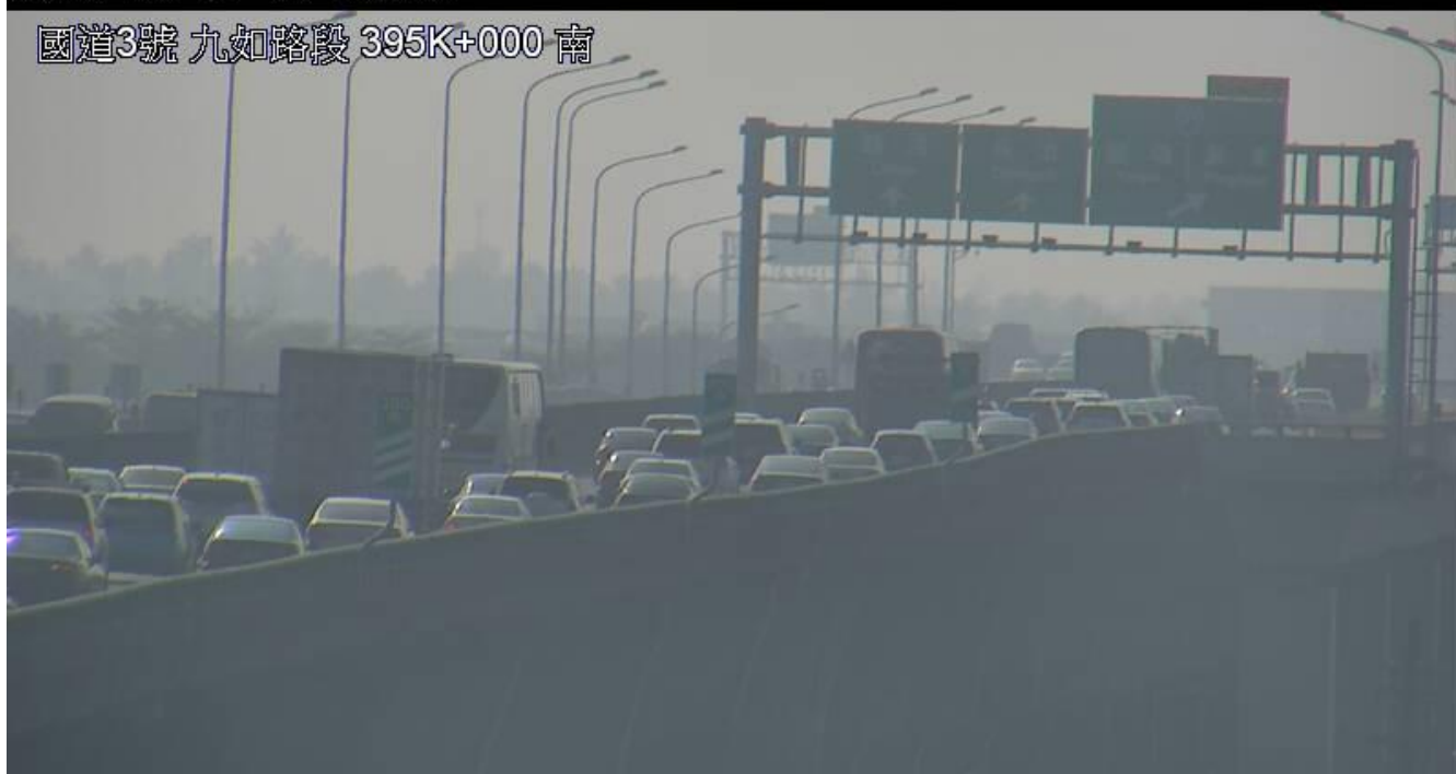
圖 1：8 時 47 分國 3 南下 396 公里 3 輛小客車追撞占用內側車道，回堵約 2 公里