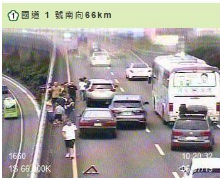
附圖 3. 10 時 16 分國 1 高架南向 66.1 公里 4 小客車追撞事故，回堵 4 公里