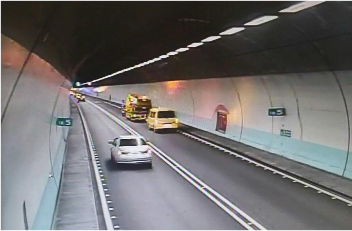
圖 1. 9 時 12 分國 5 南下雪山隧道 18.5 公里發生故障車占用外側車道事件