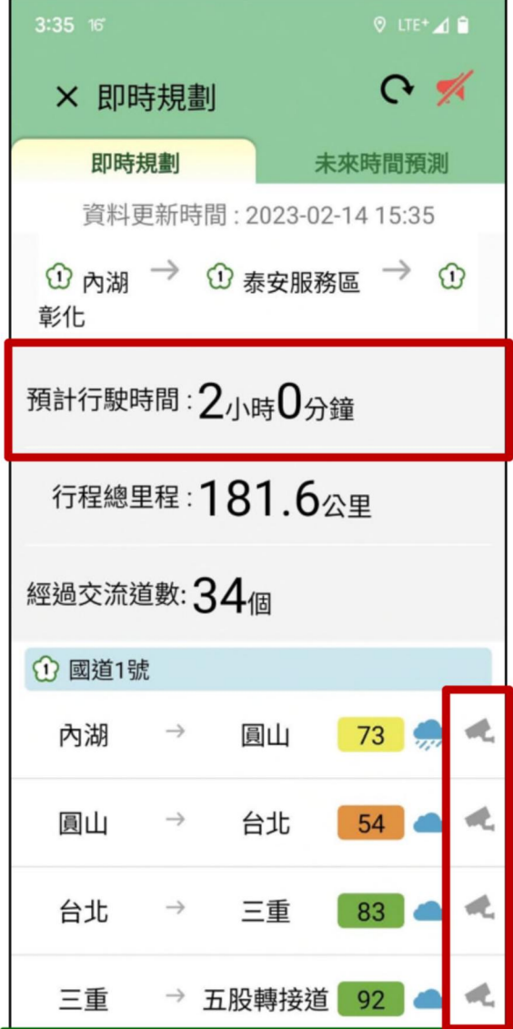
預測路徑所需行駛時間、車速、天氣