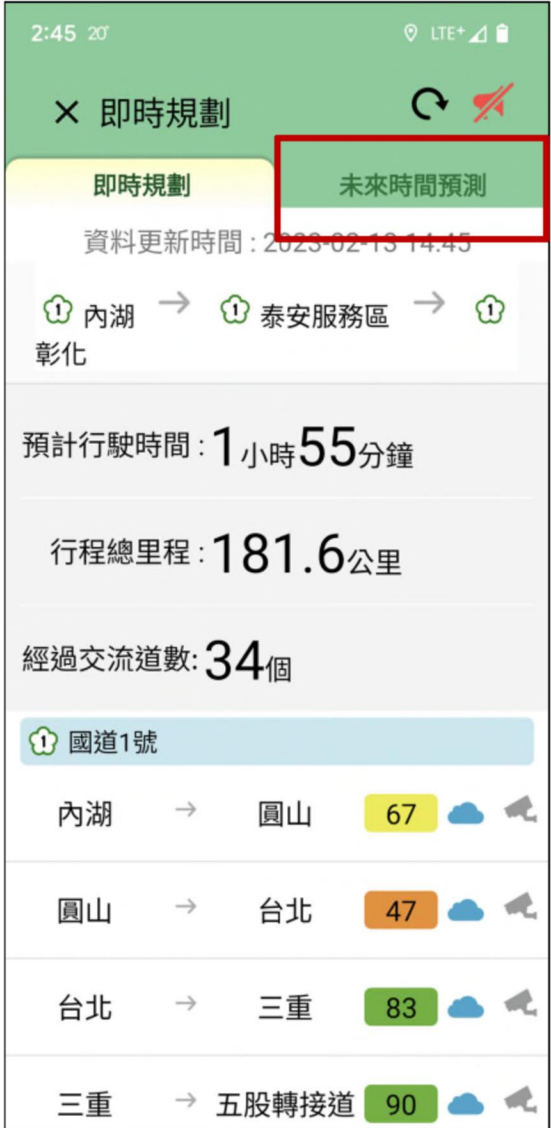
可一鍵切換為未來時間預測