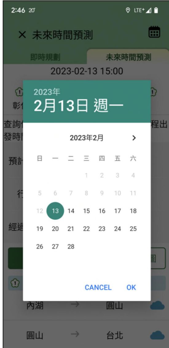
選定未來100日內時間進行查詢