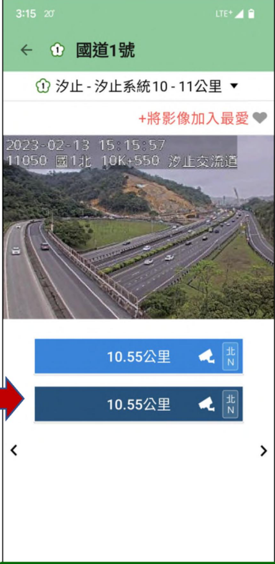
查詢路段即時影像資訊