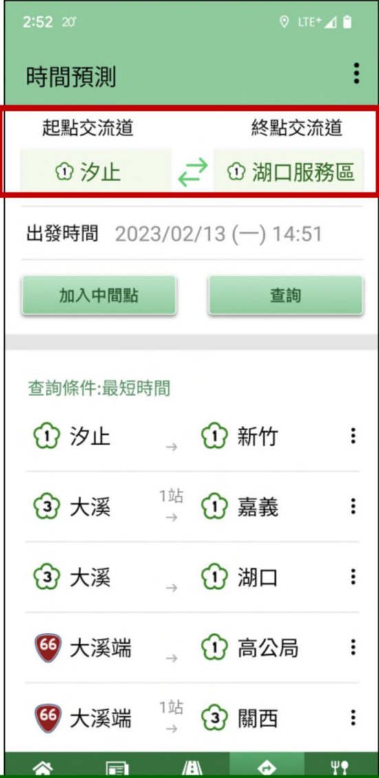
可選定各服務區或休息站為路徑起點、終點或中間點