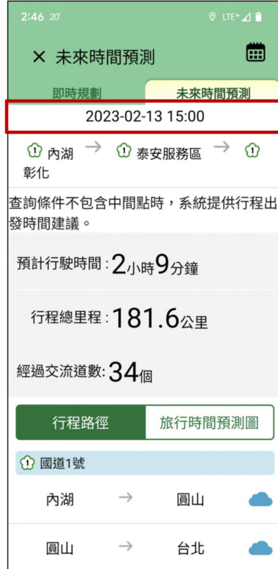
提供指定時間之行駛時間預測結果