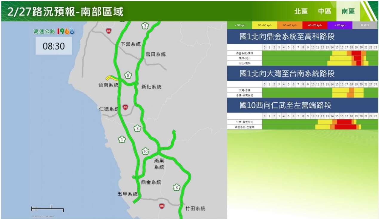
附圖 12：和平紀念日連假第 3 日路況預測(南區)