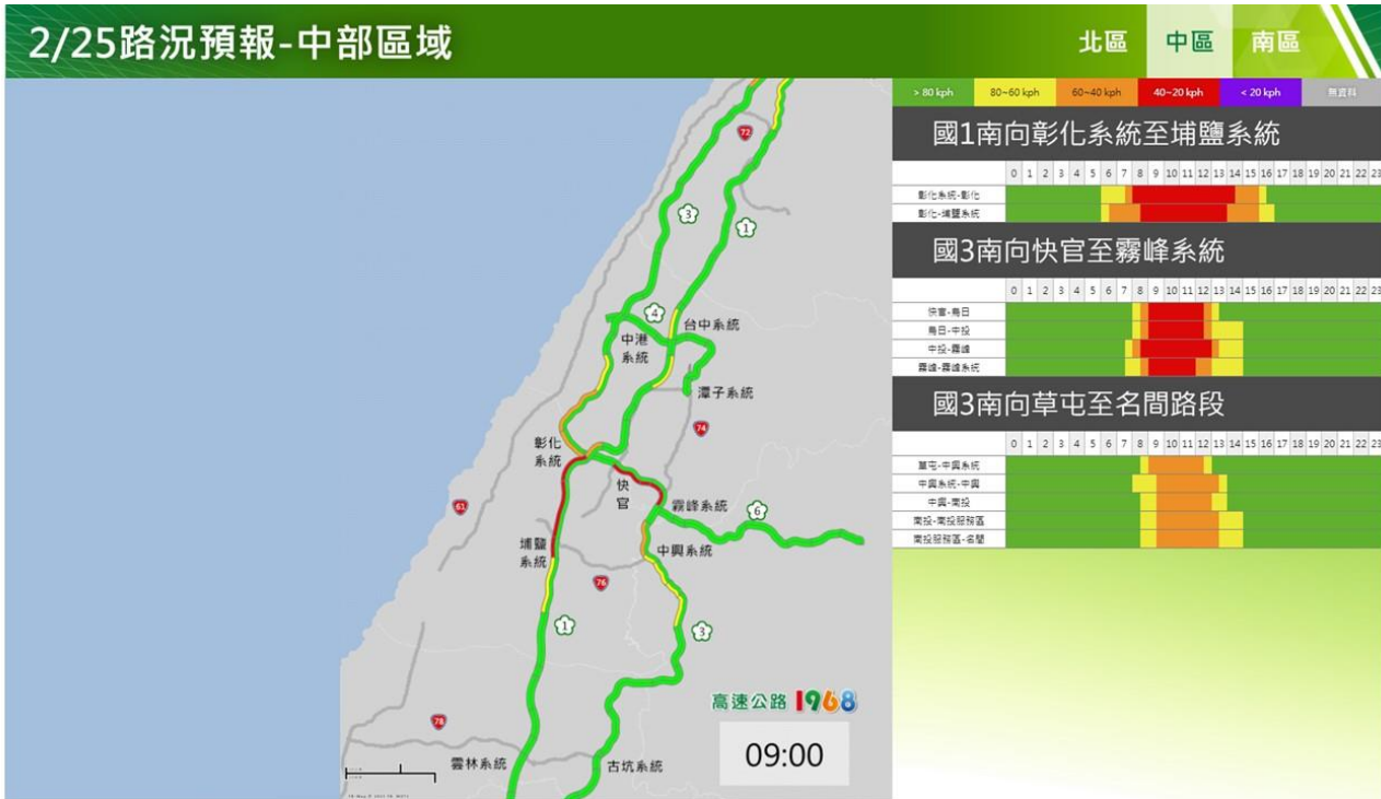
附圖 5：和平紀念日連假首日路況預測(中區)