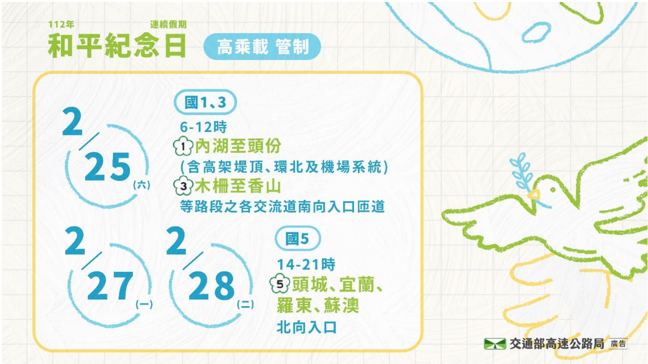
附圖 16：和平紀念日連假高乘載管制措施懶人包