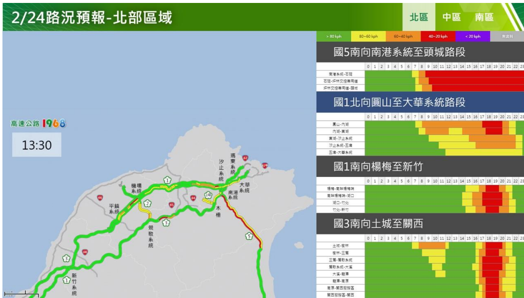
附圖 1：和平紀念日連假前 1 日路況預測(北區)