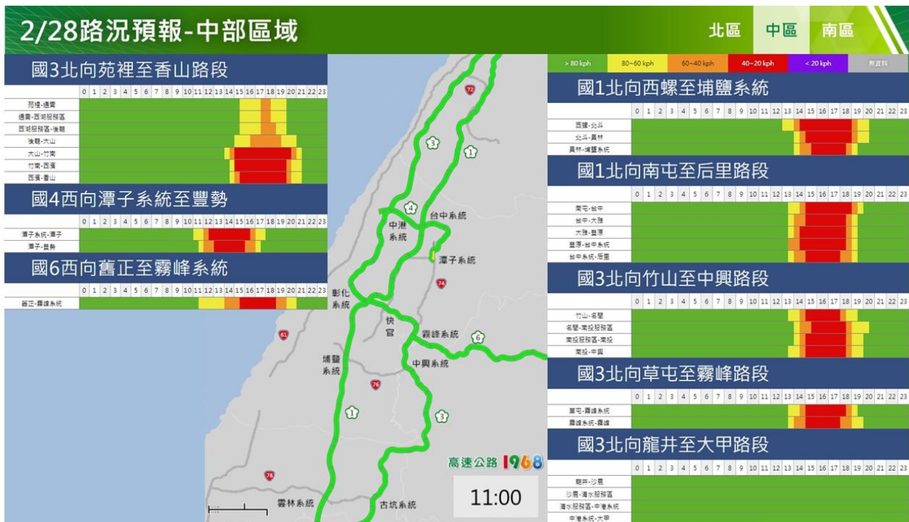
附圖 14：和平紀念日連假收假日路況預測(中區)