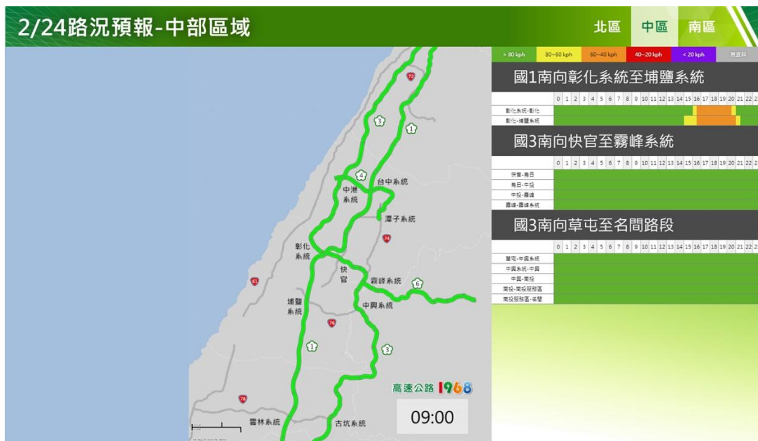
附圖 2：和平紀念日連假前 1 日路況預測(中區)