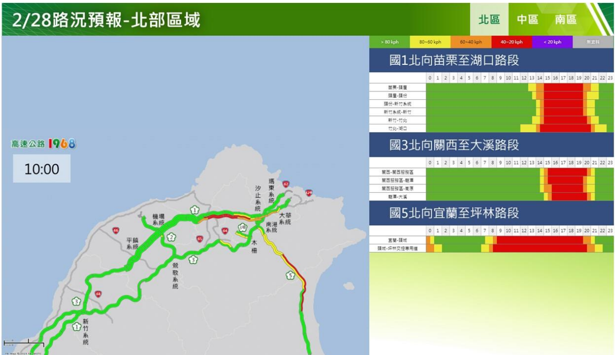
附圖 13：和平紀念日連假收假日路況預測(北區)