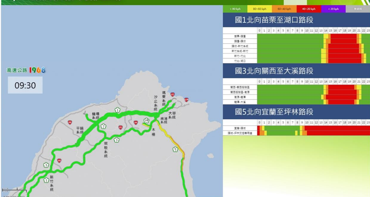
附圖 10：和平紀念日連假第 3 日路況預測(北區)