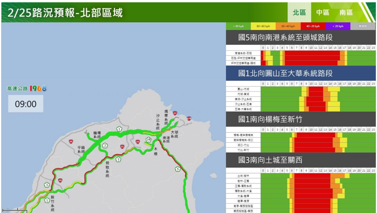
附圖 4：和平紀念日連假首日路況預測(北區)