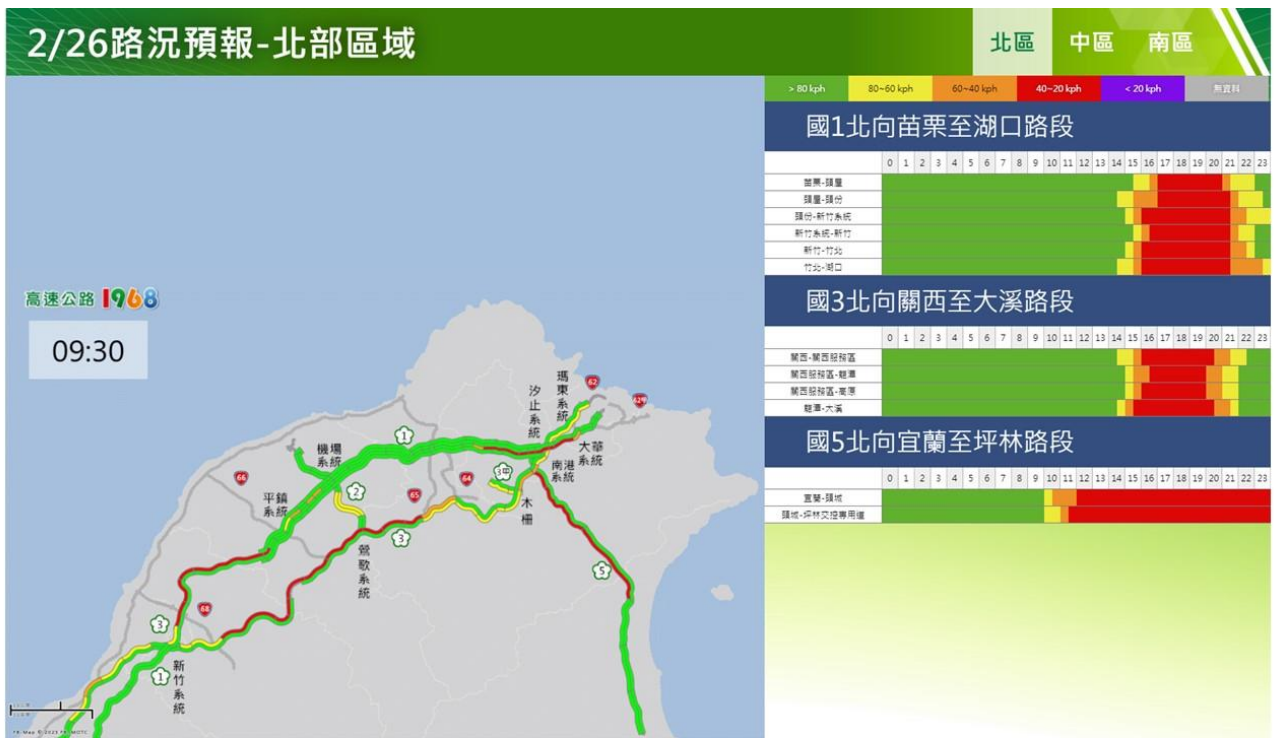
附圖 7：和平紀念日連假第 2 日路況預測(北區)