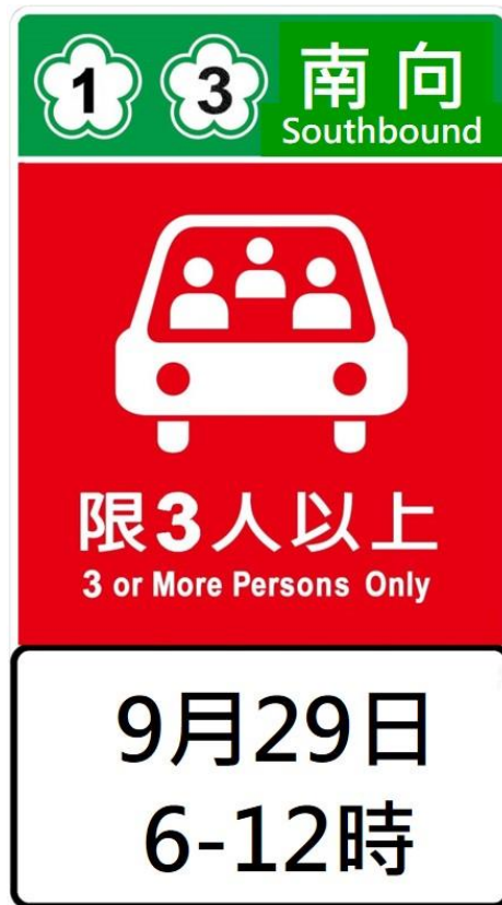
附圖 2 紅底白字文字型禁制性告示牌