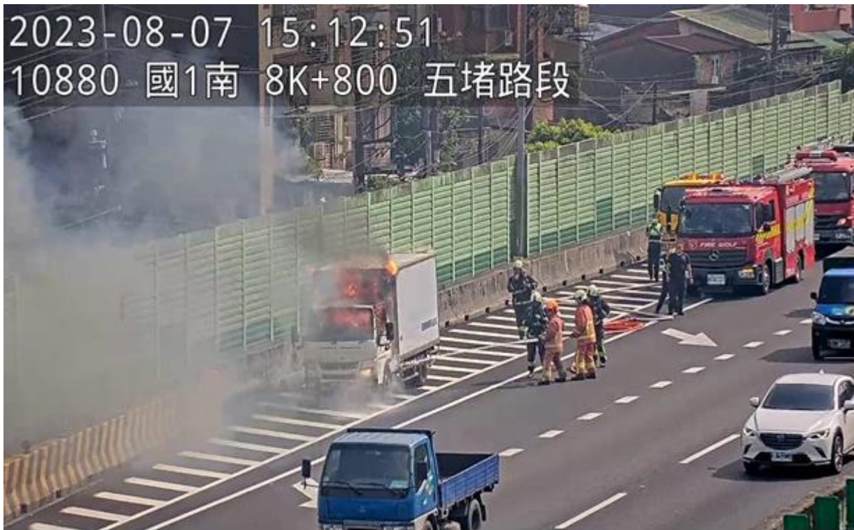
圖 1 112年8月7日15時08分，國1北向8.9k處1輛小貨車起火燃燒，佔用外側車道及外側路肩