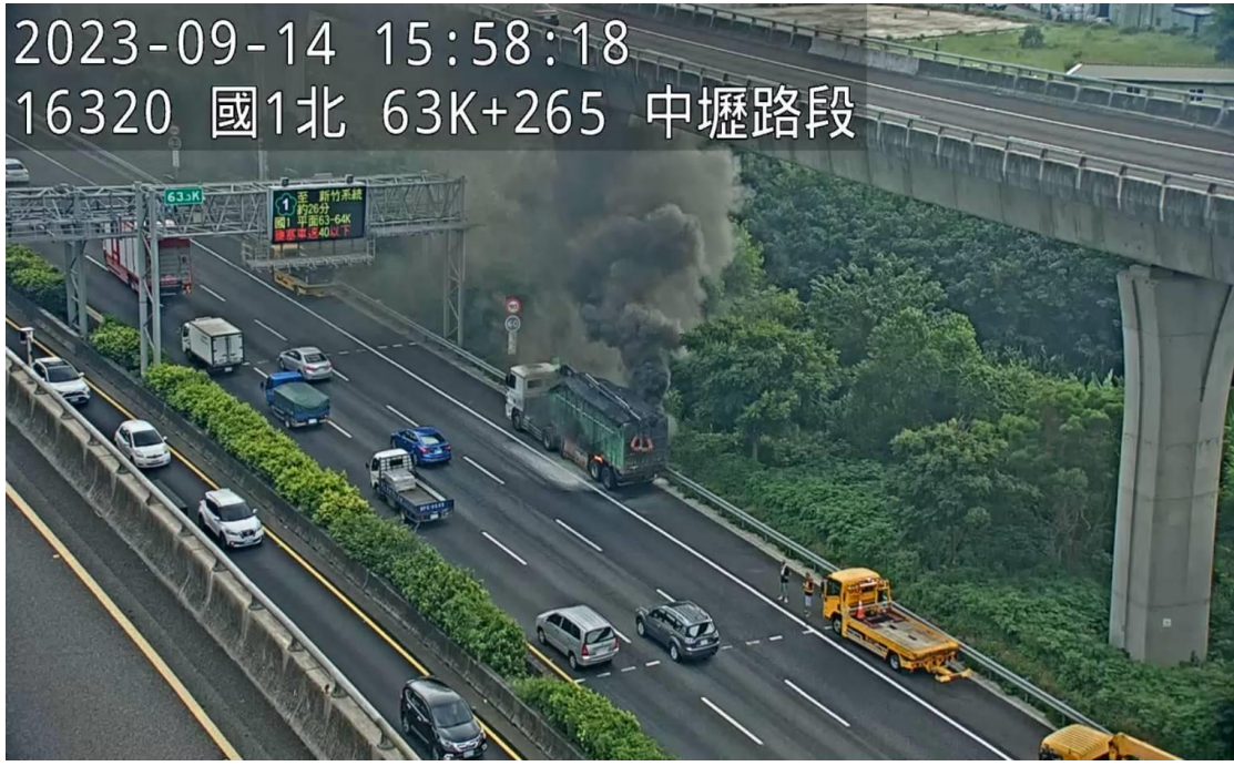
圖 3 112 年 9 月 14 日 15 時 56 分，國 1 南向 63.4k 處 1 輛大貨車後輪起火，佔用外側車道及外側路肩

2023-09-14 15:58:18 16320 國1北 63K+265 中壢路段