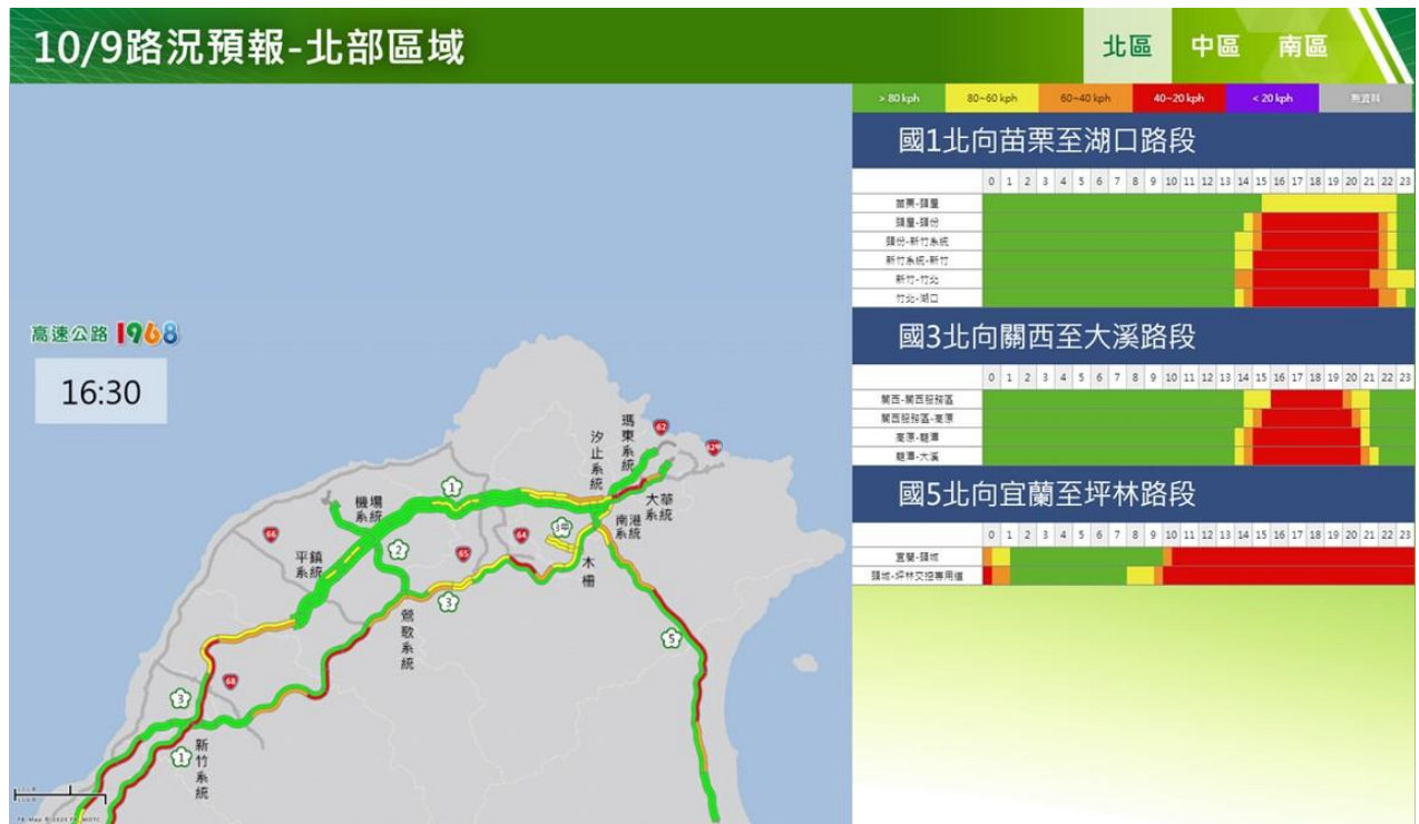
附圖 13：112 年國慶日連續假期第 3 日路況預測(北區)