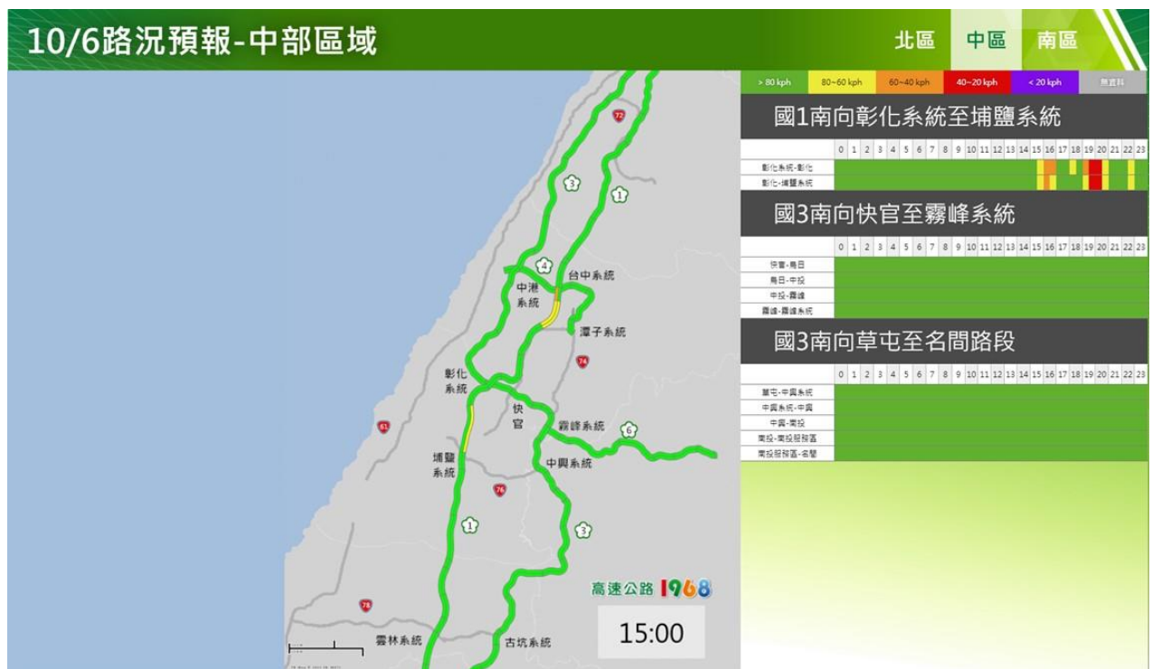
附圖 2：112 年國慶日連續假期前 1 日路況預測(中區)