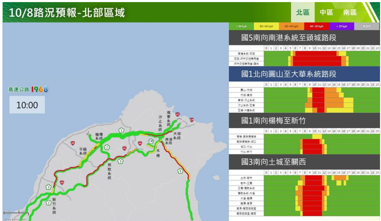
附圖 7：112 年國慶日連續假期第 2 日路況預測(北區南向)