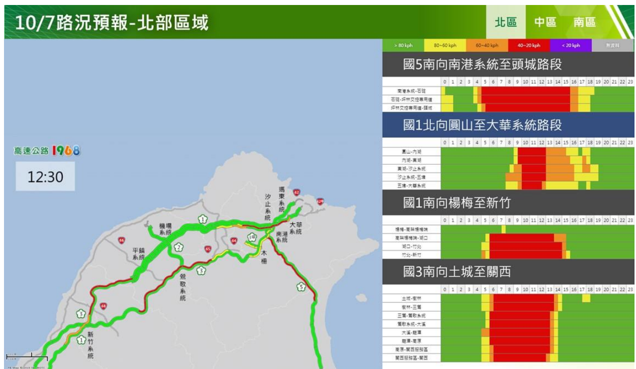
附圖 4：112 年國慶日連續假期第 1 日路況預測(北區)