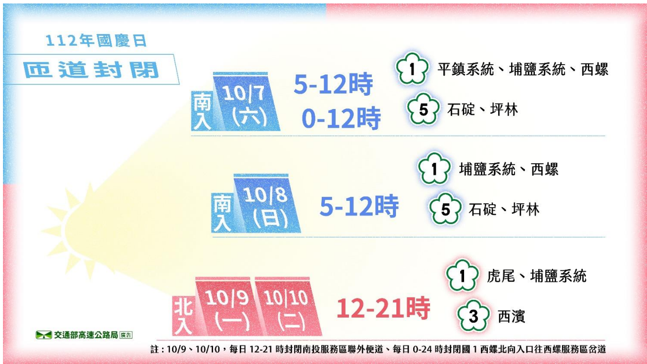
附圖 19：112 年國慶日連假匝道封閉措施懶人包