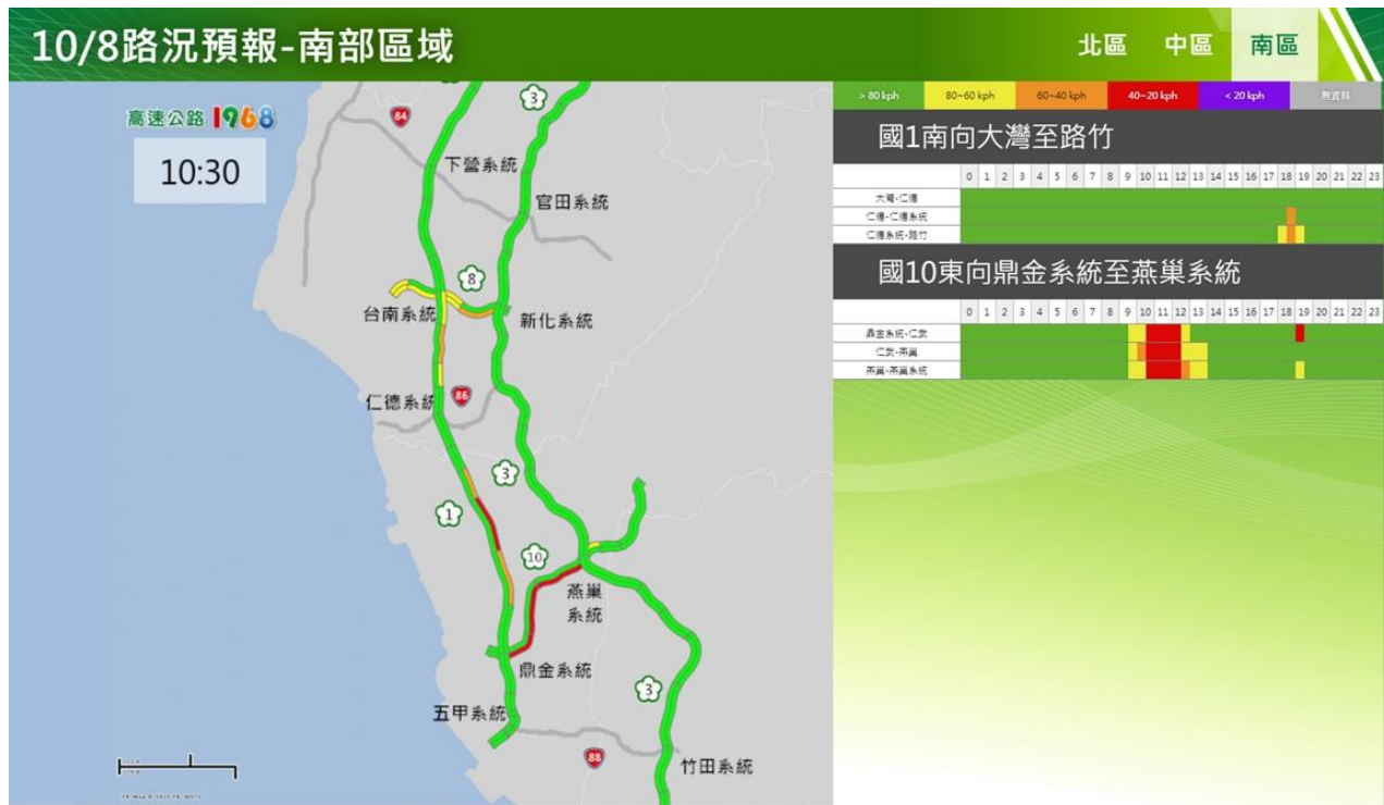
附圖 11：112 年國慶日連續假期第 2 日路況預測(南區南向)