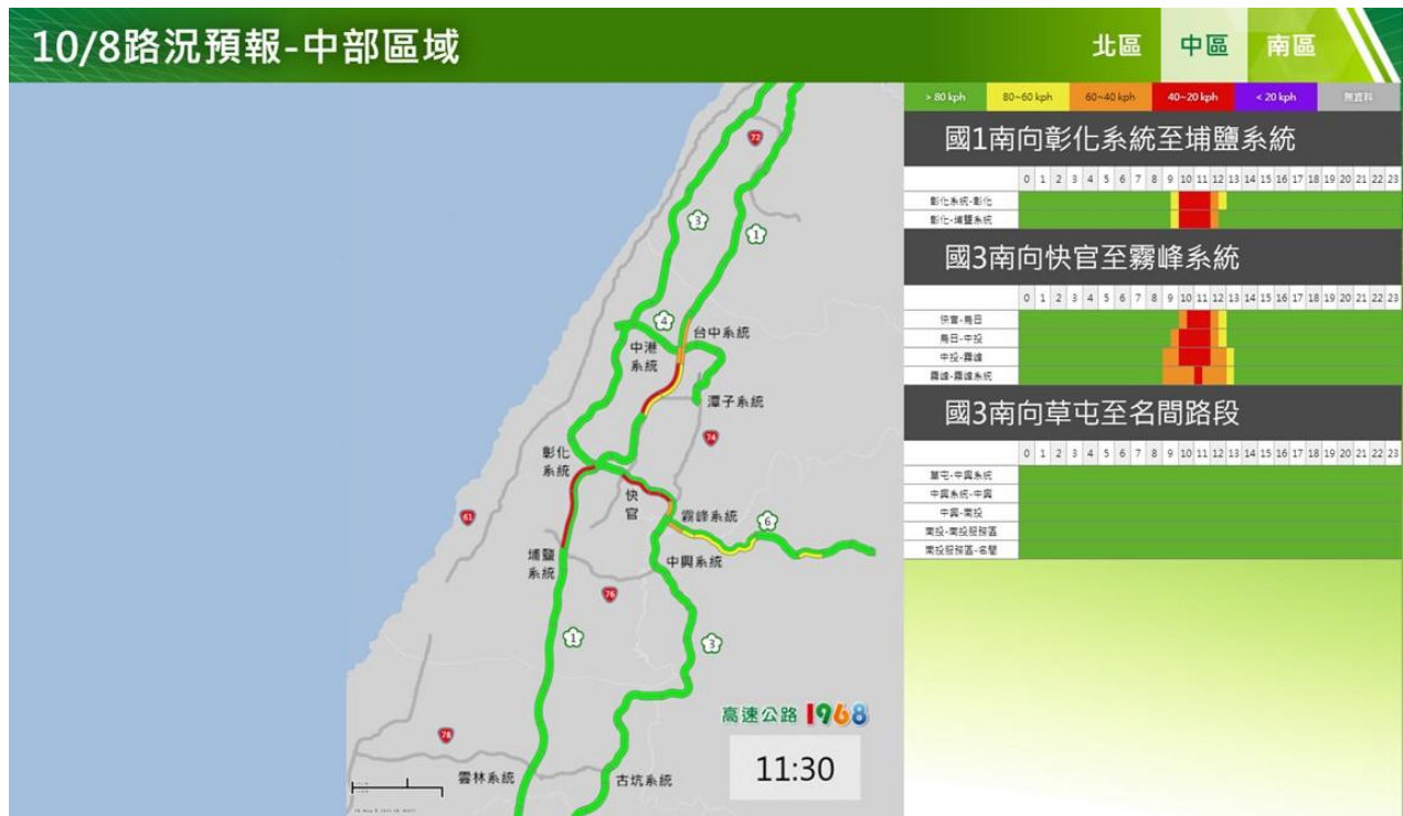
附圖 9：112 年國慶日連續假期第 2 日路況預測(中區南向)