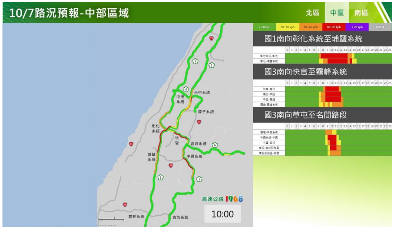
附圖 5：112 年國慶日連續假期第 1 日路況預測(中區)