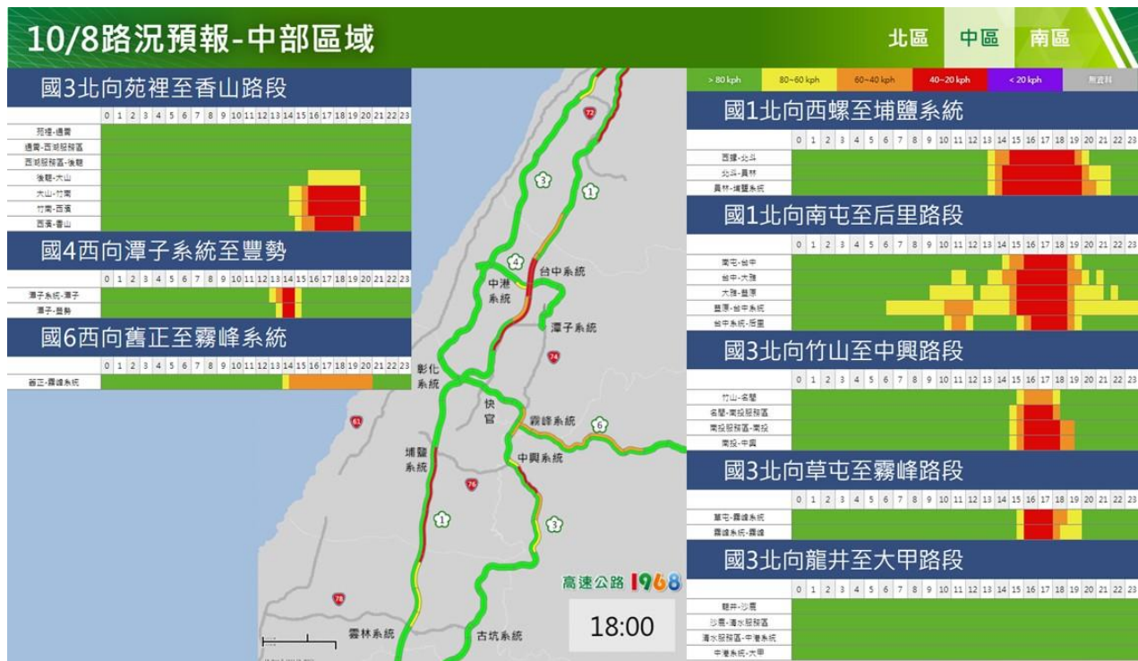
附圖 10：112 年國慶日連續假期第 2 日路況預測(中區北向)