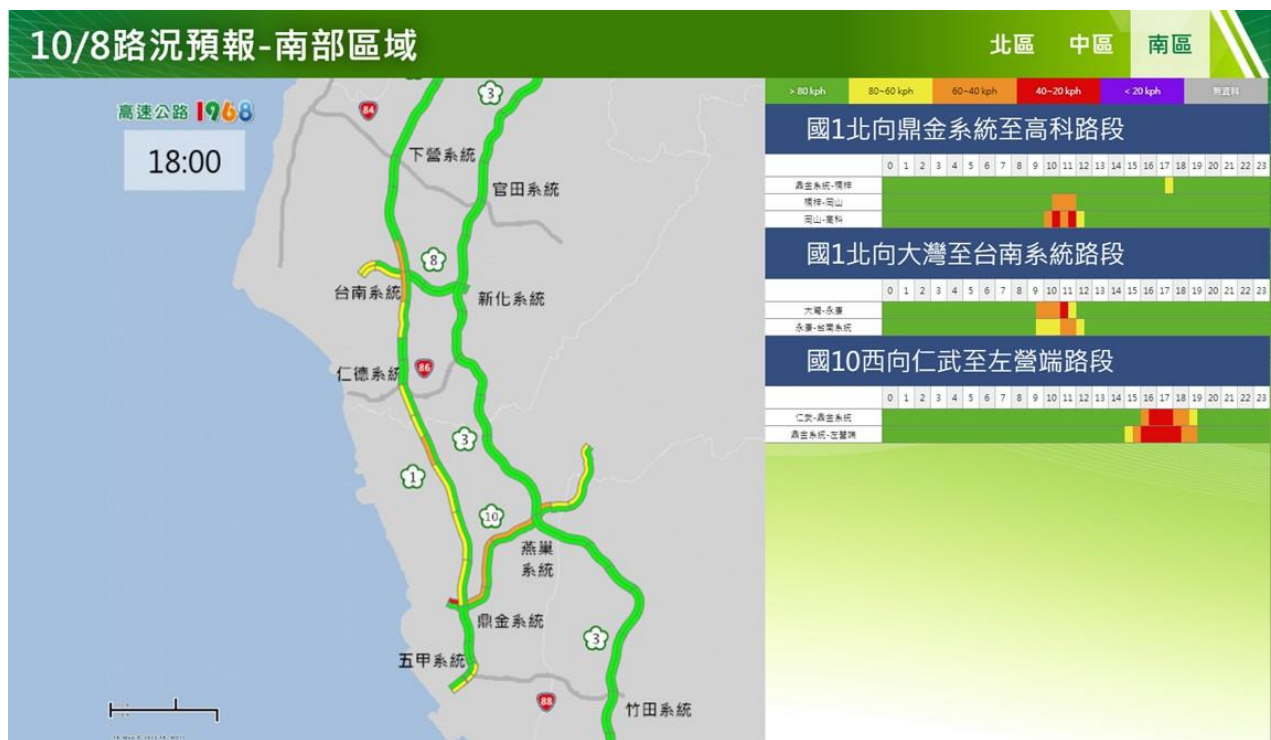
附圖 12：112 年國慶日連續假期第 2 日路況預測(南區北向)