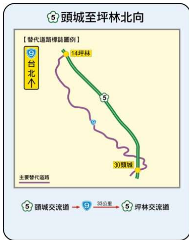
附圖 1 國道長途替代道路圖