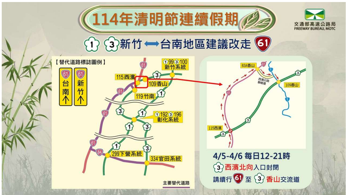
附圖 2 替代道路