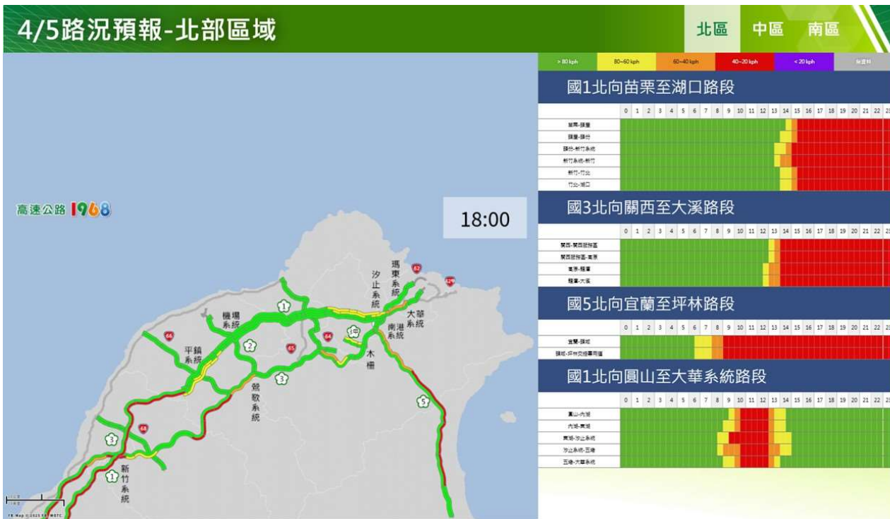
附圖 10：清明節連假第 3 日路況預測(北區)