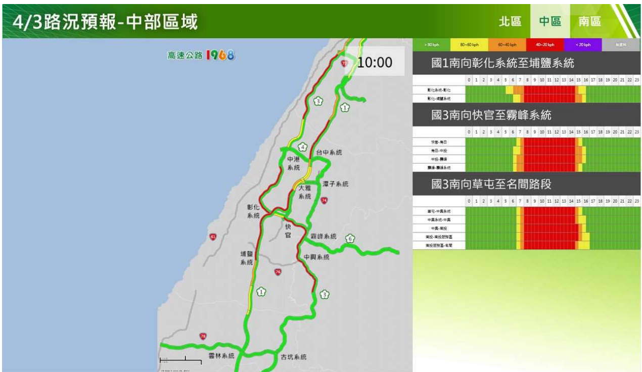
附圖 5：清明節連假首日路況預測(中區)