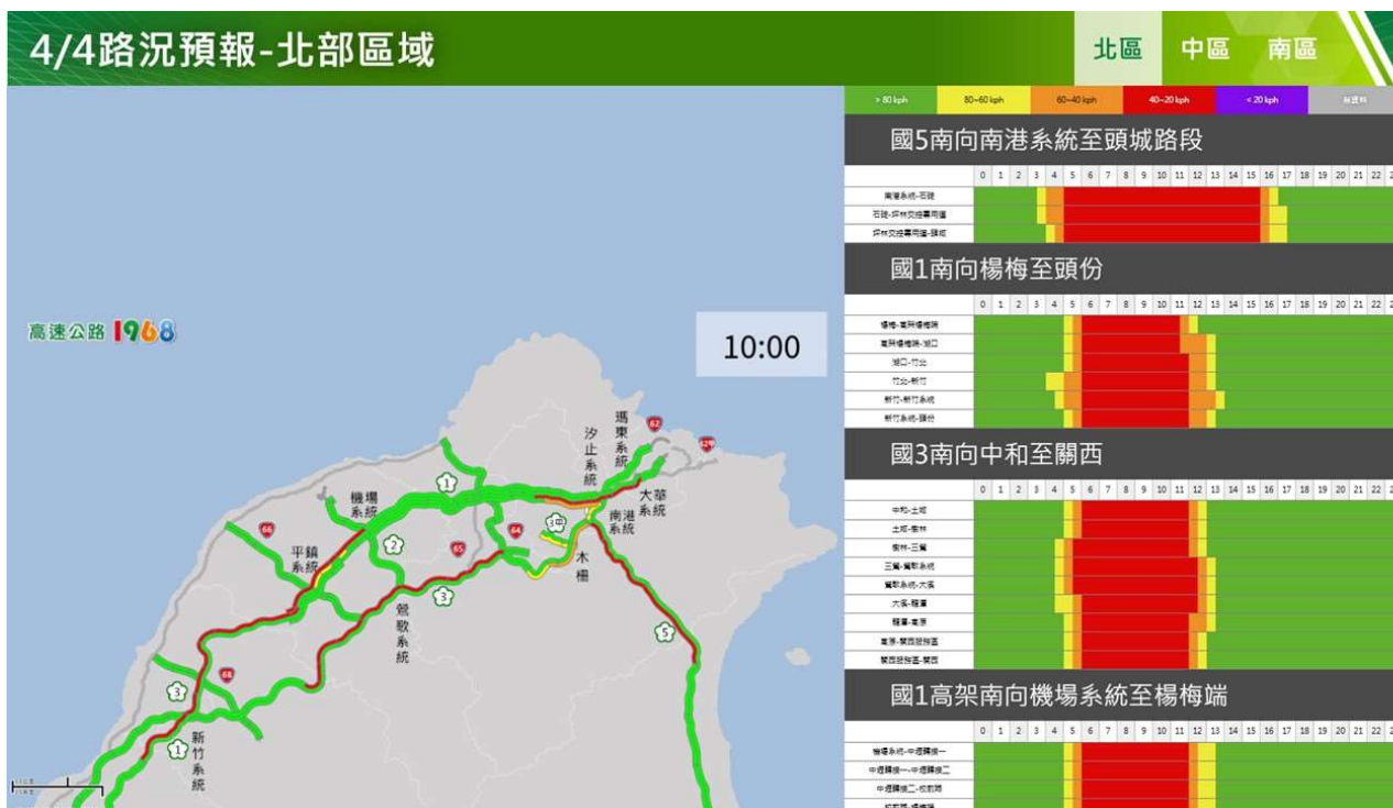
附圖 7：清明節連假第 2 日路況預測(北區)