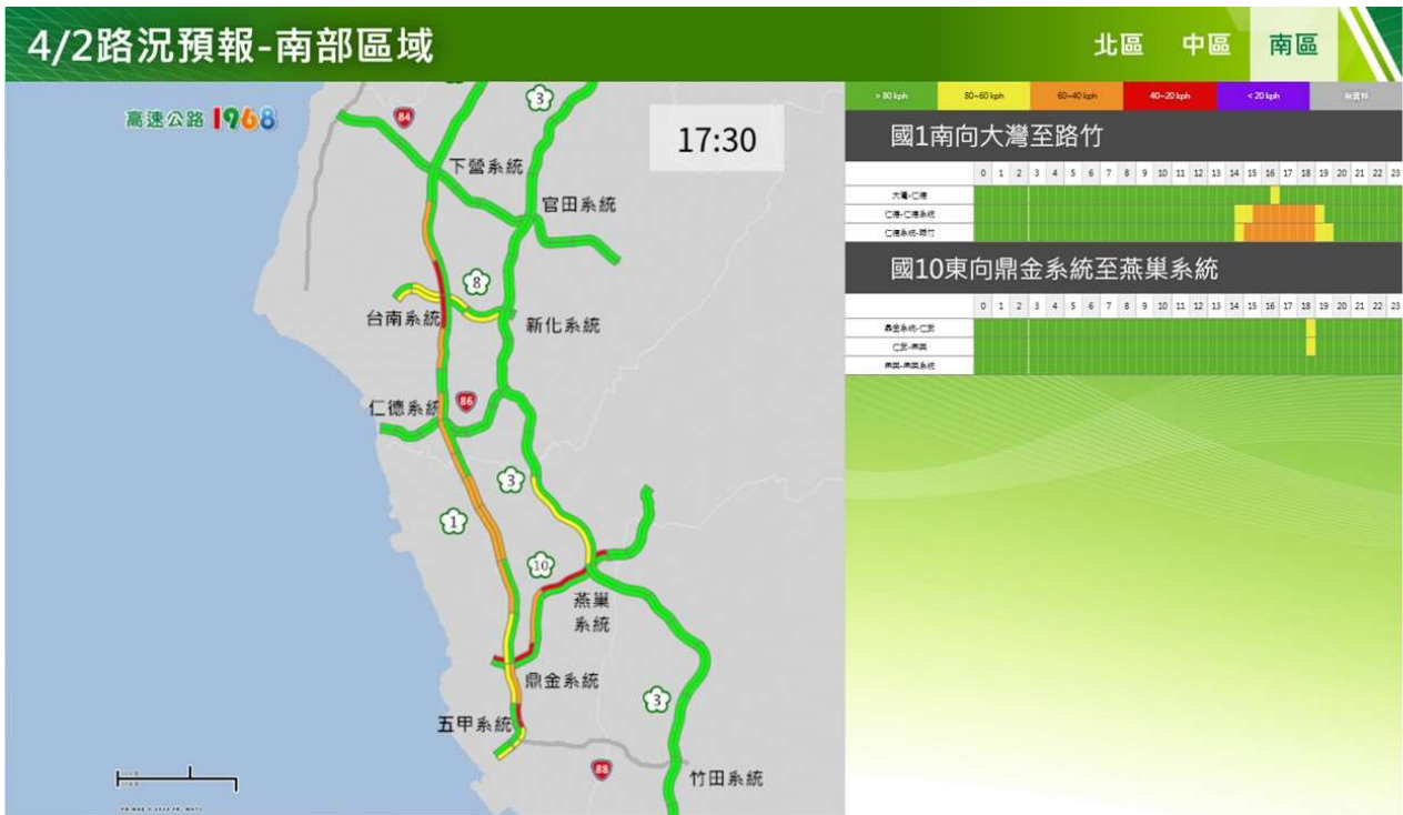
附圖 3：清明節連假前 1 日路況預測(南區)