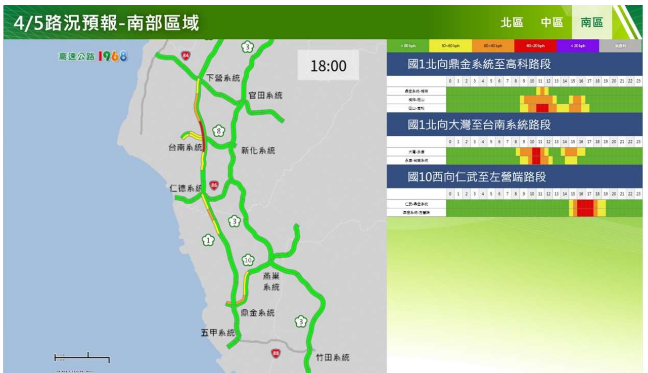
附圖 12：清明節連假第 3 日路況預測(南區)