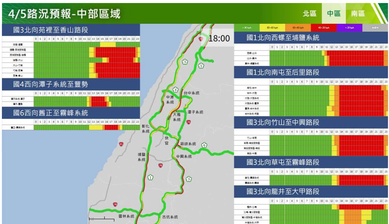
附圖 11：清明節連假第 3 日路況預測(中區)