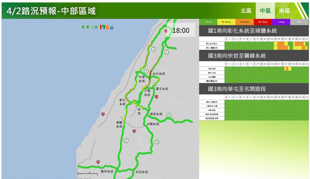
附圖 2：清明節連假前 1 日路況預測(中區)