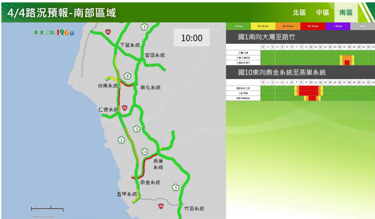
附圖 9：清明節連假第 2 日路況預測(南區)