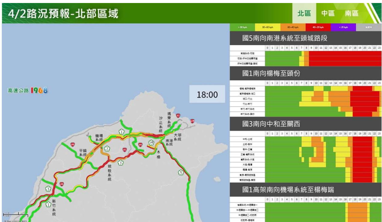
附圖 1：清明節連假前 1 日路況預測(北區)