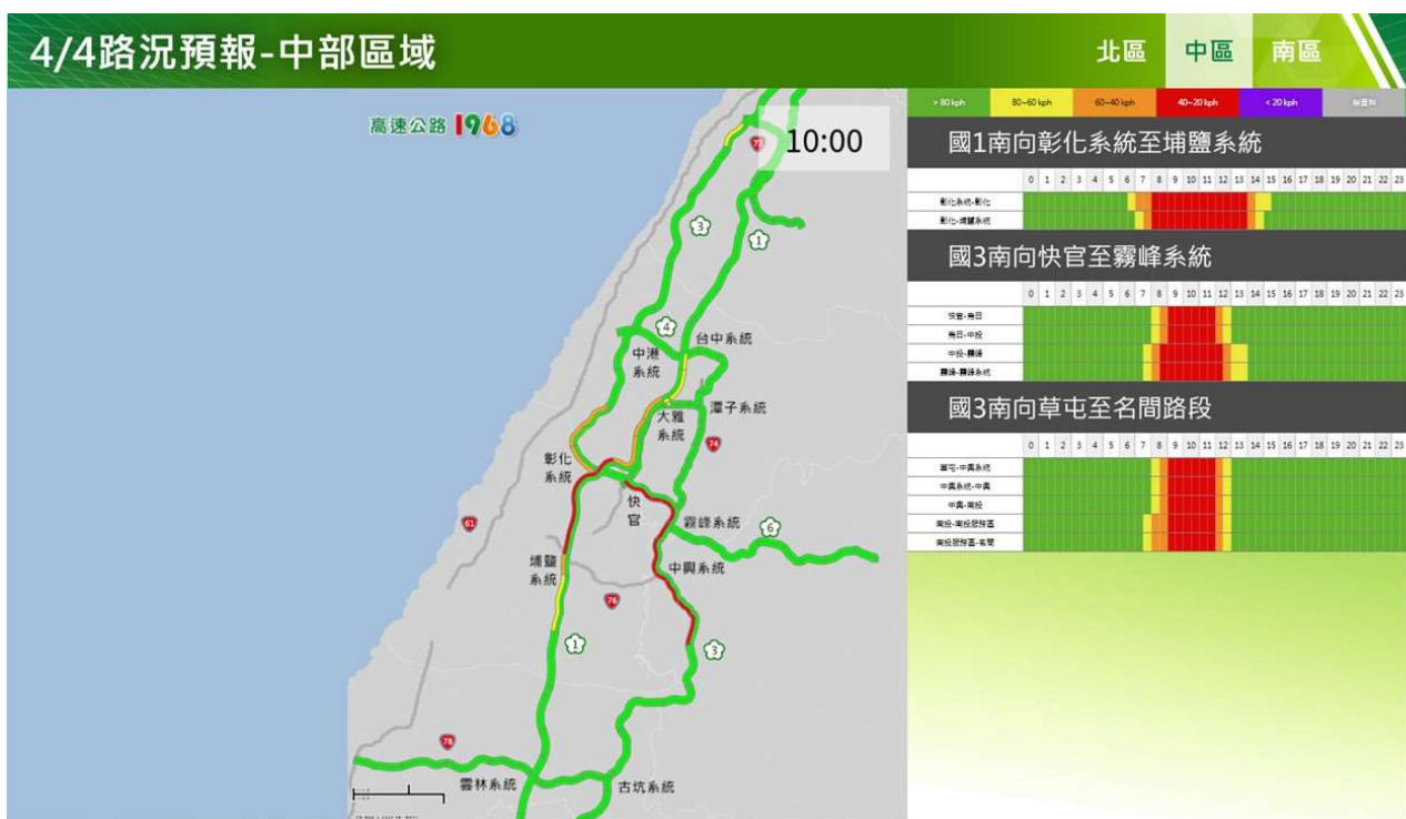
附圖 8：清明節連假第 2 日路況預測(中區)